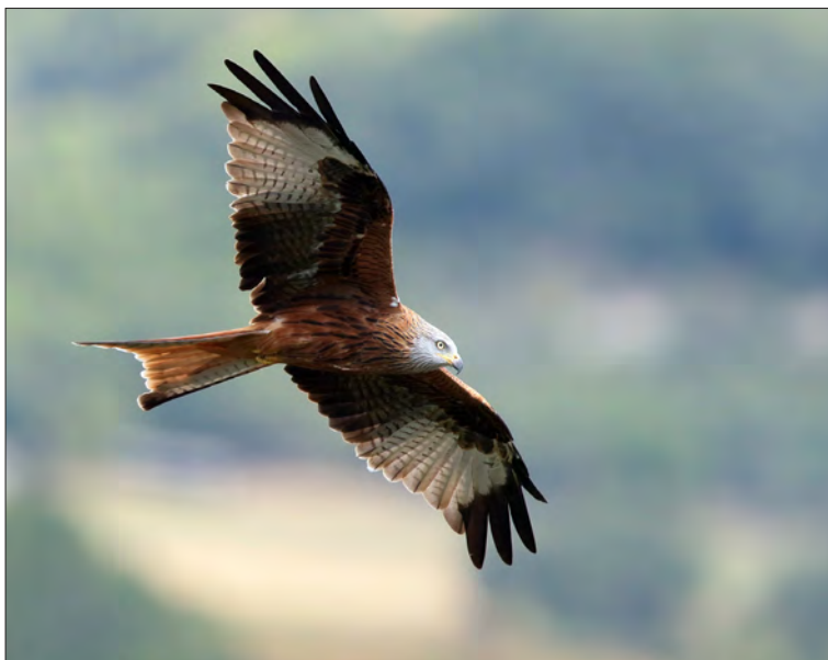
13. Milan royal Milvus milvus , adulte, Espagne, septembre 2020 (Fabrice & Laurent Desage). Adult Red Kite.