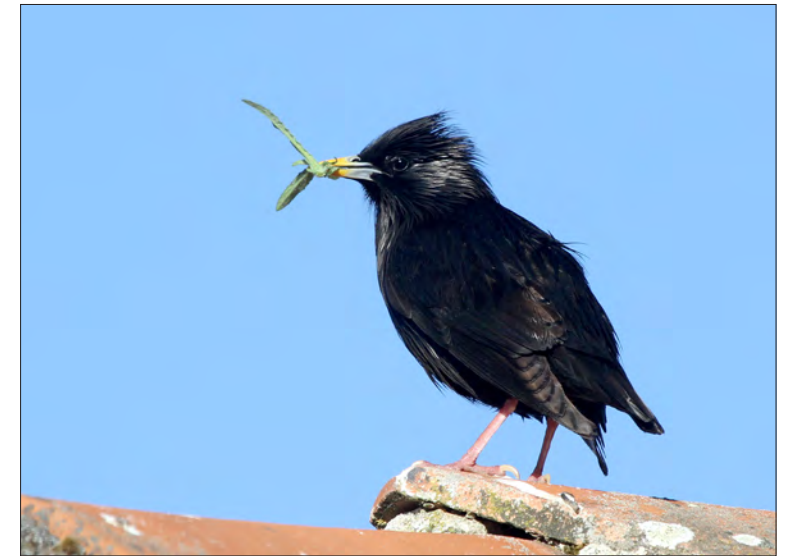
21. Étourneau unicolore Sturnus unicolor , mâle, Estrémadure, Espagne, mai 2013 (Gilles Balança). Male Spotless Starling.

Les observations et reprises de bague de la sous-espèce islandaise coburni ont été analysées et confirment sa présence régulière en France, entre mi-octobre et début avril, dans les départements situés à l'ouest d'une ligne reliant Saint-Malo, Ille-et-Vilaine, et Toulouse, Haute-Garonne ; il s'agit en majorité d'oiseaux de 1 re année, les adultes hivernant majoritairement dans les îles Britanniques (DUQUET 2018).