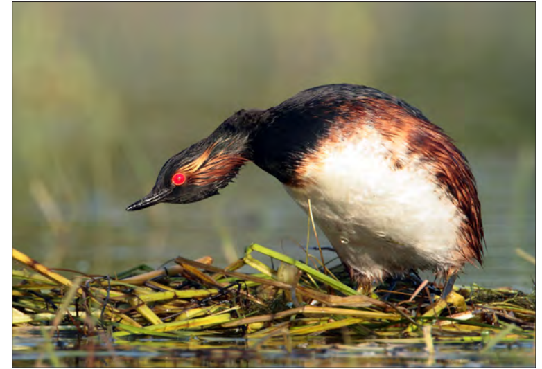
5. Grèbe à cou noir Podiceps nigricollis , adulte au nid, Brenne, avril 2011. Adult Black-necked Grebe.

ISSA & MULLER 2015), la population nationale de l'espèce s'avère être en très fort déclin depuis 2017, en lien avec les sécheresses à répétition. Elle est estimée à 520-820 couples en 2017-2018 et seulement 310-460 couples en 2019 (TROTIGNON 2021 ; voir aussi Ornithos 28-4 : 280).