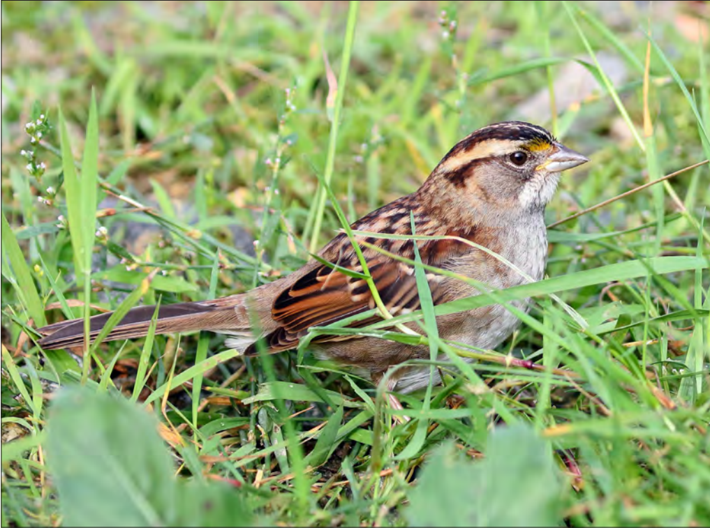
25. Bruant à gorge blanche Zonotrichia albicollis , 1 re année, Ouessant, octobre 2021 (Julien Gonin). 1st-yr White-throated Sparrow.