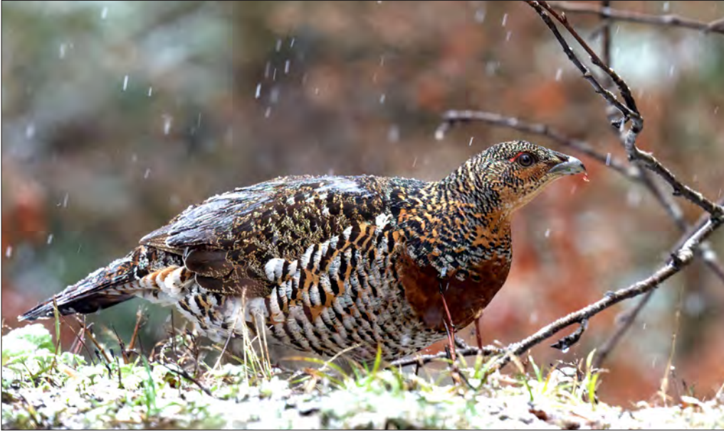
1. Grand Tétrás Tetrao urogallus , femelle, Jura, mai 2011 (Thomas Perrier). Female Capercaillie.