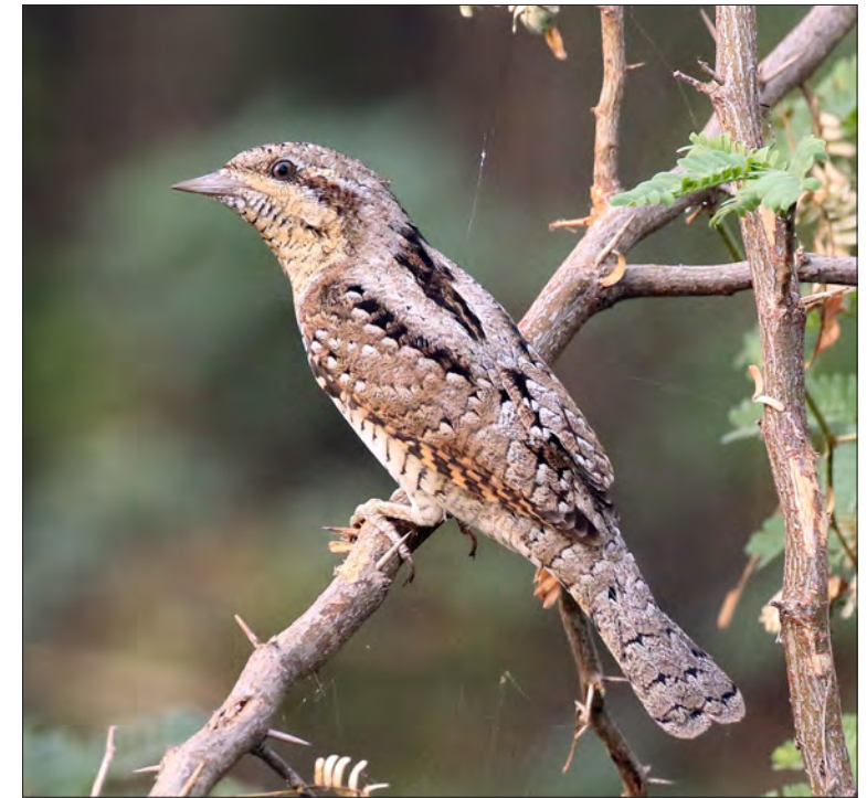
15. Torcol fourmilier Jynx torquilla , Rajasthan, Inde, novembre 2019 (Philippe J. Dubois). Eurasian Wryneck .

L'espèce poursuit sa progression en Languedoc-Roussillon : dans les Pyrénées-Orientales, première observation départementale le 11 juin 2020 à Prades (GOR) et présence de 2 individus (couple ?) manifestant un comportement territorial le 3 février 2021 à Rabouillet (F. Olivier, Faune France) ; dans l'Aude et l'Hérault, où les premiers cas de reproduction ont été signalés respectivement en juin 2018 à Montjardin (S. Tillo, Faune France) et en juin 2019 à Ceilhes-et-Rocozels (F. Legendre, Faune France).