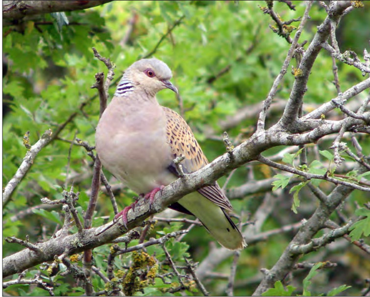
4. Tourterelle des bois Streptopelia turtur , Tarn, juin 2007 (Christian Aussaguel). European Turtle Dove.