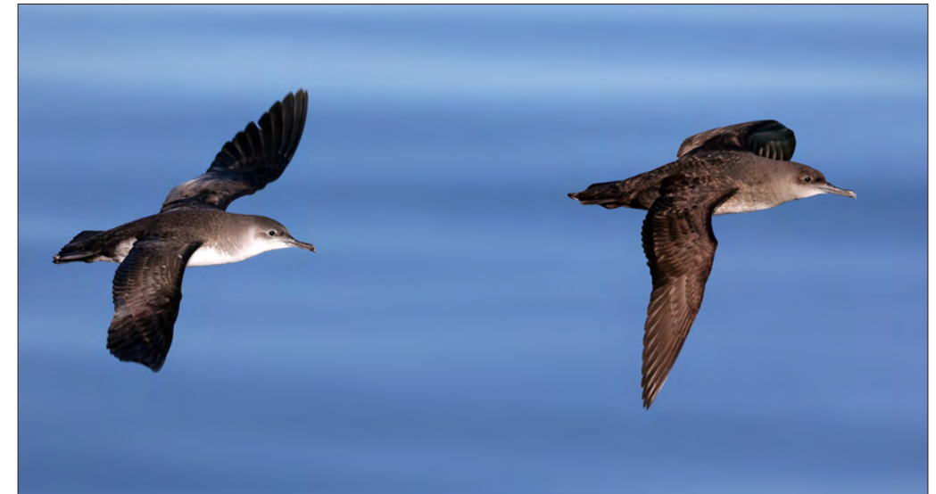
10. Puffin yelkouan Puffinus yelkouan (à gauche) et Puffin des Baléares P. mauretanicus , Hérault, janvier 2022. Yelkouan Shearwater (left) with Balearic Shearwater .

vidus observés et photographiés appartenait probablement à cette espèce. Il s'agit des premiers cas documentés indiquant la présence de ce puffin au large des côtes atlantiques françaises. Cependant, il existe une forme particulière du Puffin des Baléares – le petit « minorquin » – qui ressemble fortement au Puffin yelkouan (GENOVART et al. 2012), et même si son identification n'est pas parfaitement maîtrisée et que ses effectifs sont extrêmement faibles (quelques centaines d'individus?), on ne peut, en l'état actuel des connaissances, totalement exclure la présence de ce type d'oiseau dans l'Atlantique.