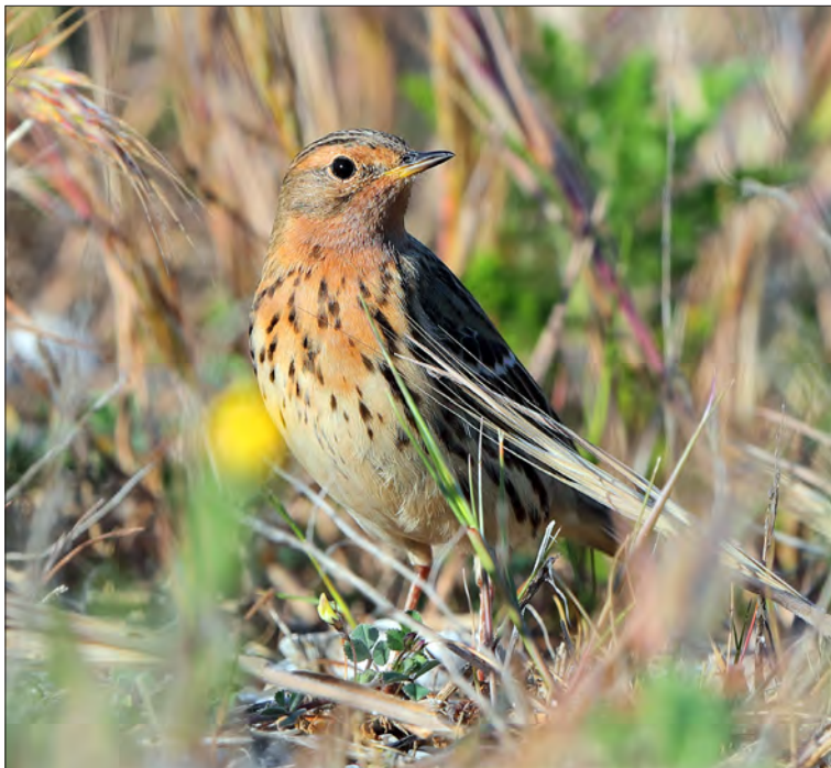
23. Pipit à gorge rousse Anthus cervinus , Var, avril 2021. Red-throated Pipit.

À partir de la mi-octobre 2017, un nombre de sizerins beaucoup plus important que d'ordinaire a atteint la France. Le baguage a montré que la plupart provenaient du Royaume-Uni. Des oiseaux ont été observés jusqu'en Camargue (POISSON & PROVOST 2019).