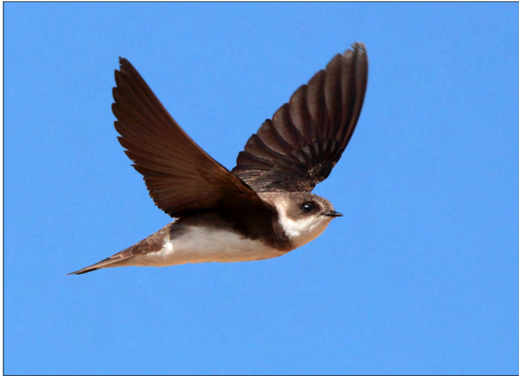
17. Hirondelle de rivage Riparia riparia , adulte, Côtes-d'Armor, mai 2011. Adult Sand Martin.