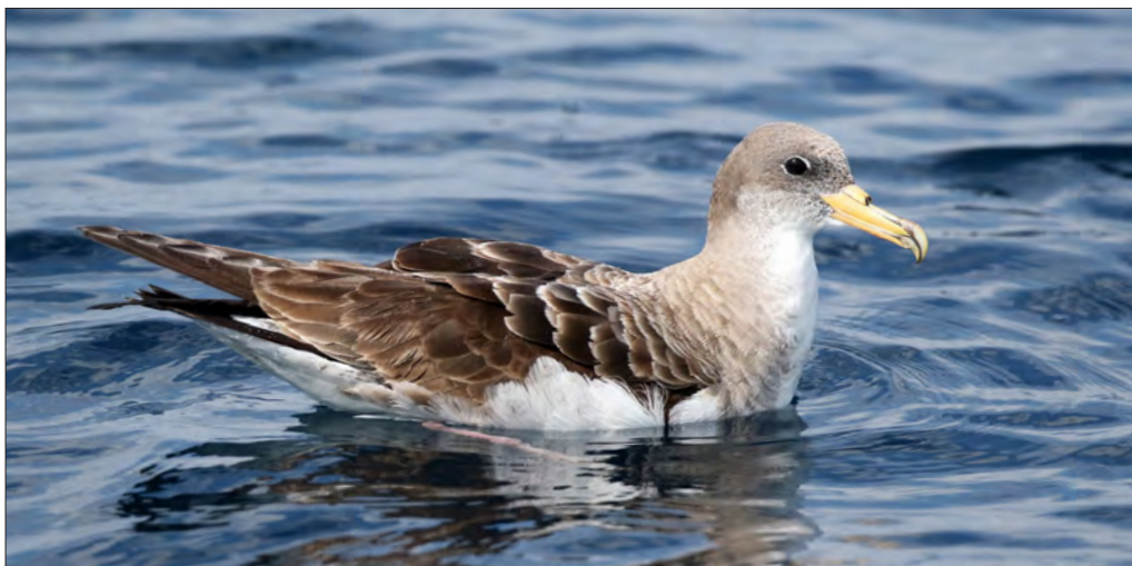
Ornithos 29-5 : 265-306 (2022)

9. Puffin cendré Calonectris borealis, Finistère, août 2020. Cory's Shearwater.