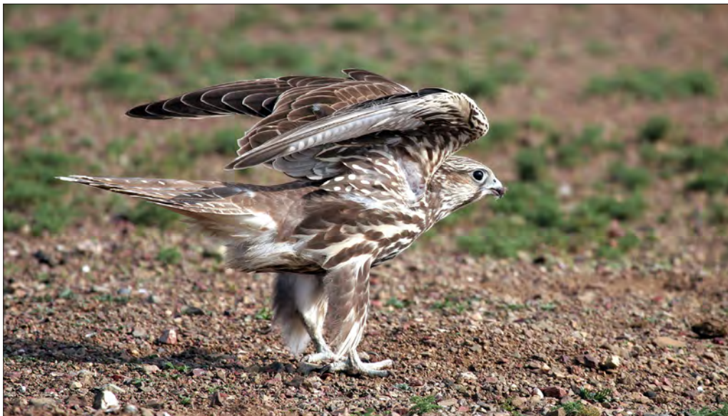
16. Faucon sacre Falco cherrug , 1 re année, Mongolie, août 2007 (Matthieu Vaslin). 1st-cy Saker Falcon.

Des oiseaux attardés en novembre 2020 : une femelle adulte a été photographiée le 16 à Vauvert, Gard (J.-P. Trouillas), et un mâle adulte a séjourné du 18 au 29 à Marvejols, Lozère, à près de 800 m d'altitude (C. Goux et R. Destre, Faune LR).