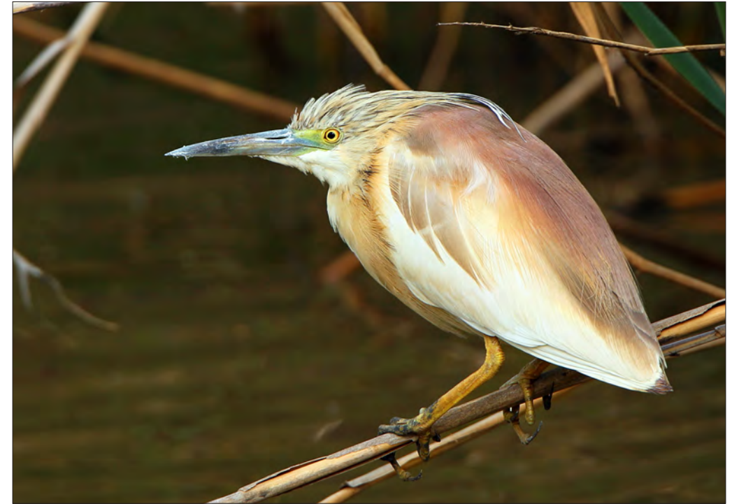
11. Crabier chevelu Ardeola ralloides , adulte, Hyères, Var, avril 2012. Adult Squacco Heron .

Un recensement précis des nicheurs français, effectué en 2021, indique une population de 130-150 mâles chanteurs, traduisant une chute de 50% des effectifs par rapport à 2012 (274-289 mâles chanteurs) ; les bastions de l'espèce restent la Brière, Loire-Atlantique (31-36 chanteurs) et la Camargue (54-60 chanteurs, Camargue gardoise incluse), tandis que les étangs lorrains (14-16 mâles) sont la seule zone intérieure abritant plus de 10 chanteurs (TROTIGNON 2022).