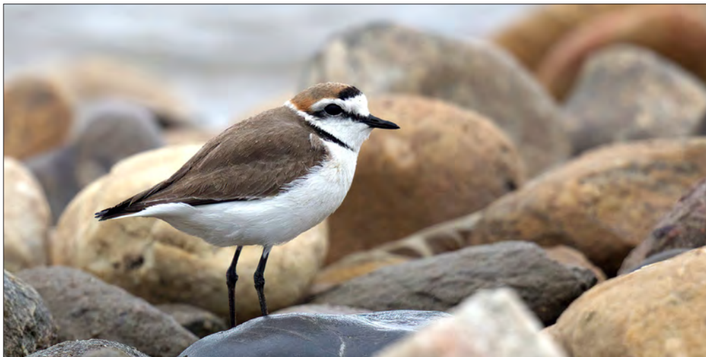
Ornithos 29-5 : 265-306 (2022)

6. Gravelot à collier interrompu Charadrius alexandrinus , mâle, Camargue, mai 2021 (Thomas Perrier). Male Kentish Plover .