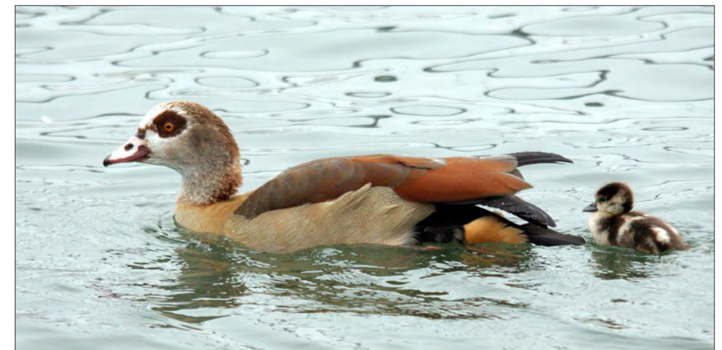
2. Ouette d'Égypte Alopochen aegyptiaca , adulte et poussin, Haut-Rhin, février 2013 (Vincent Palomares). Egyptian Goose.

La reproduction a été prouvée à Monteux, Vaucluse, avec l'observation d'un couple accompagné de deux jeunes début juillet 2017 (M.-G. Serie et É. Senes, Faune PACA).