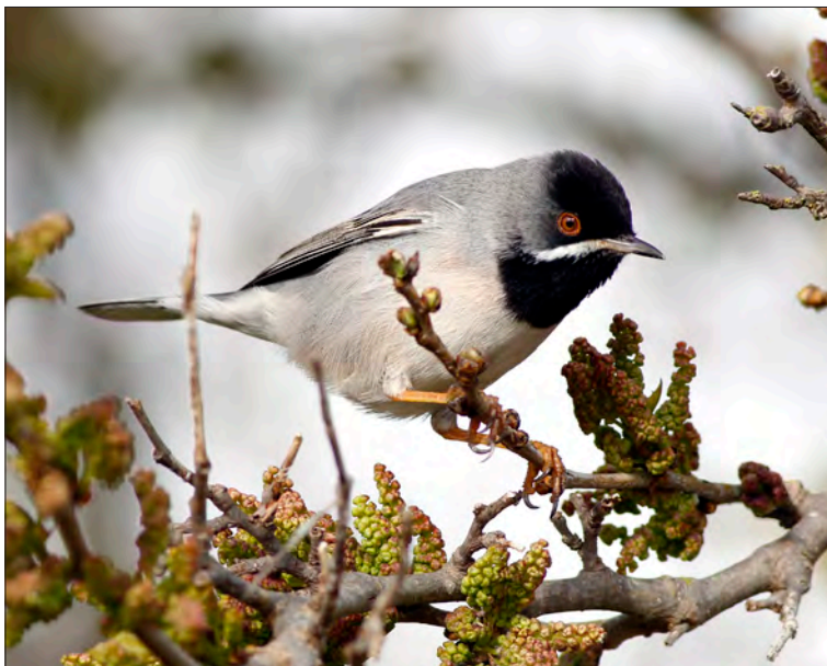
19. Fauvette de Rüppell Curruca ruppeli , mâle, Camargue, avril 2019 (Thierry Laurent). Male Rüppell's Warbler.