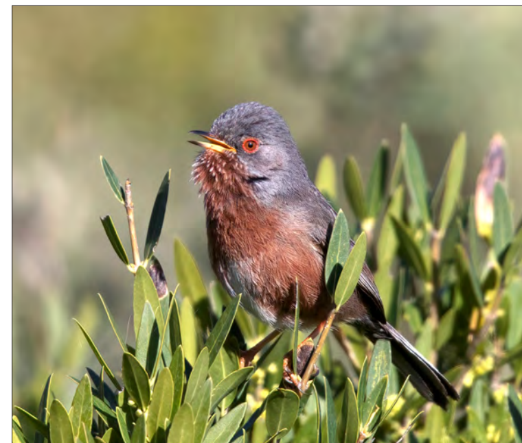
20. Fauvette pitchou Curruca undata , adulte, Bouches-du-Rhône, mars 2021 (Thomas Perrier). Male Dartford Warbler

Dans les Alpes-Maritimes, une petite population existe au-dessus de 1 200 m d'altitude : jusqu'à 3 mâles (dont un chanteur) notés en avril 2017 à Valdeblorre entre 1 218 et 1 284 m (D. Canestrier, Faune France), et même 1 individu à 1 731 m le 1 er octobre 2017 (A. Ellie, Faune France).