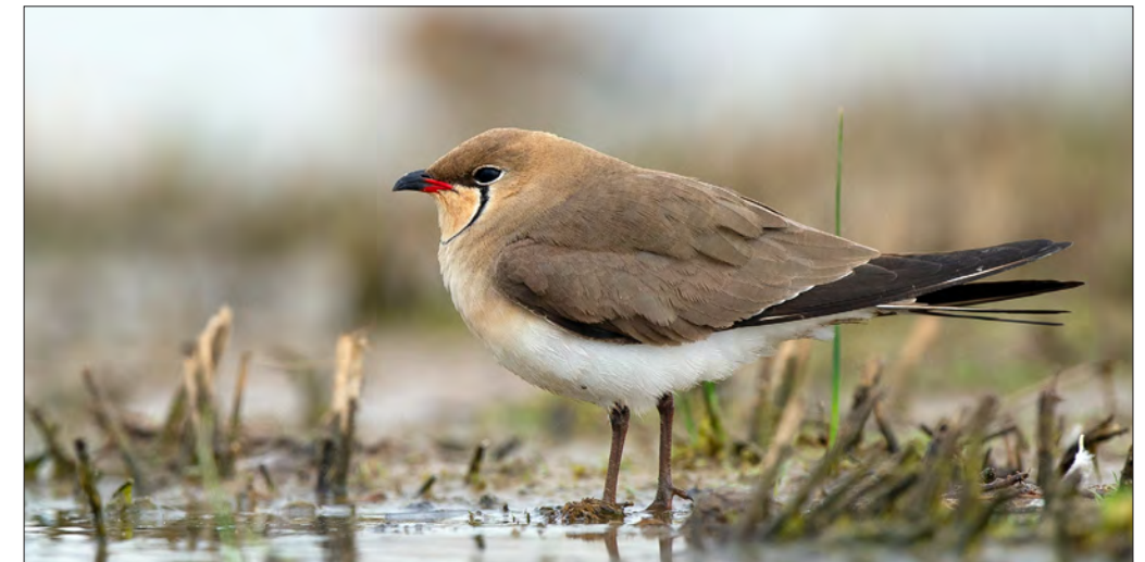
Ornithos 29-5 : 265-306 (2022)

7. Glaréole à collier Glareola pratincola, adulte, Hérault, mai 2019. Adult Common Pratincole.