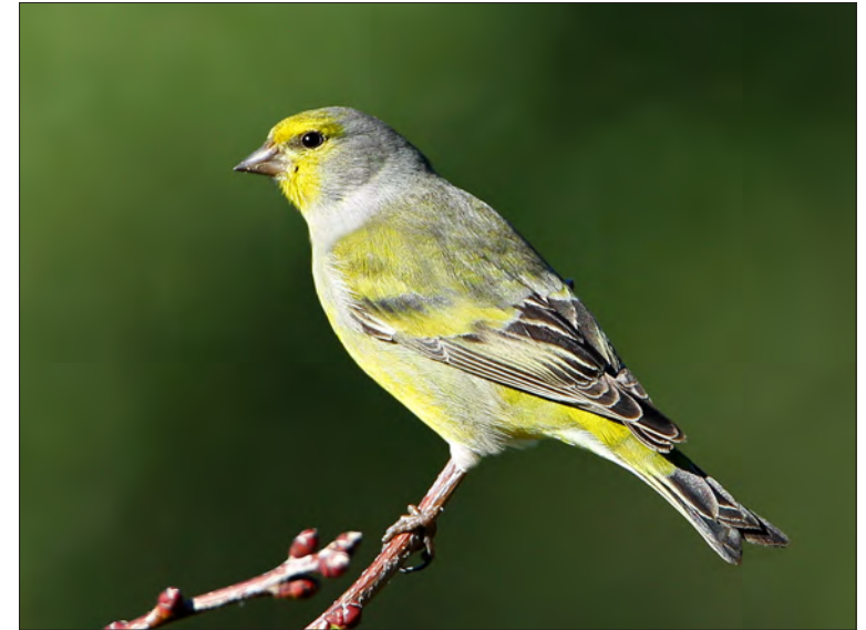
24. Venturon montagnard Carduelis citrinella , mâle, Var, décembre 2012. Male Citril Finch.