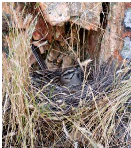
Bruant fou femelle au nid, Monfragüe