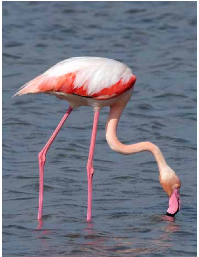
Flamant rose, delta de l'Èbre