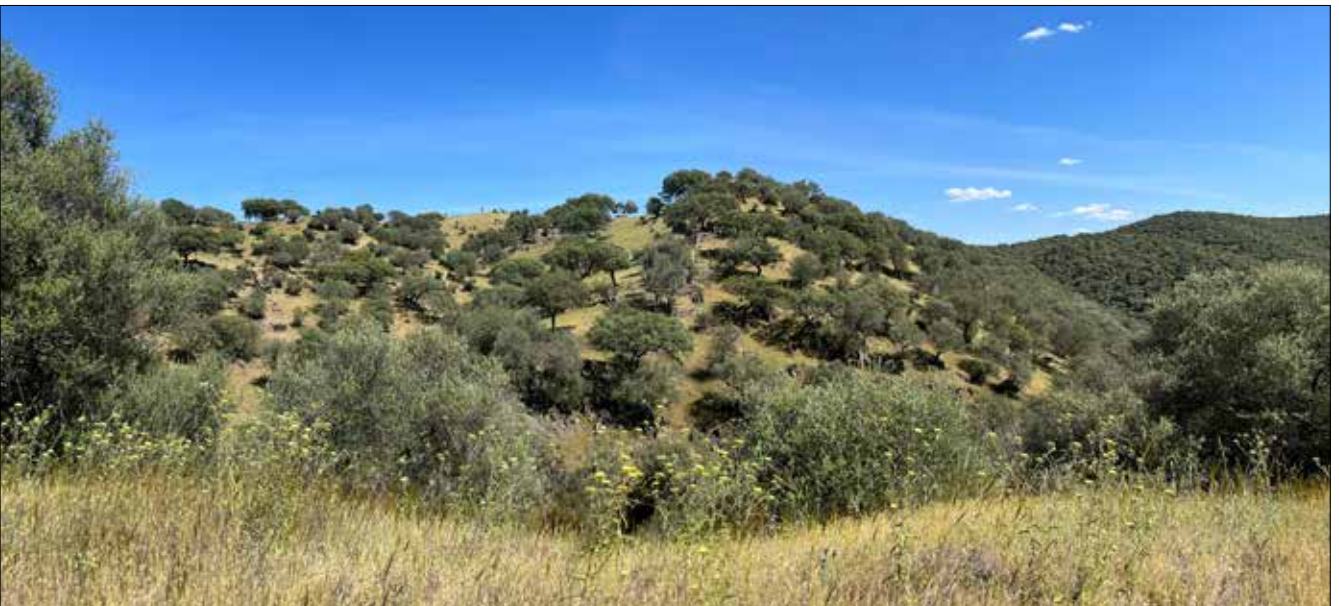
Santa Marta de Magasca