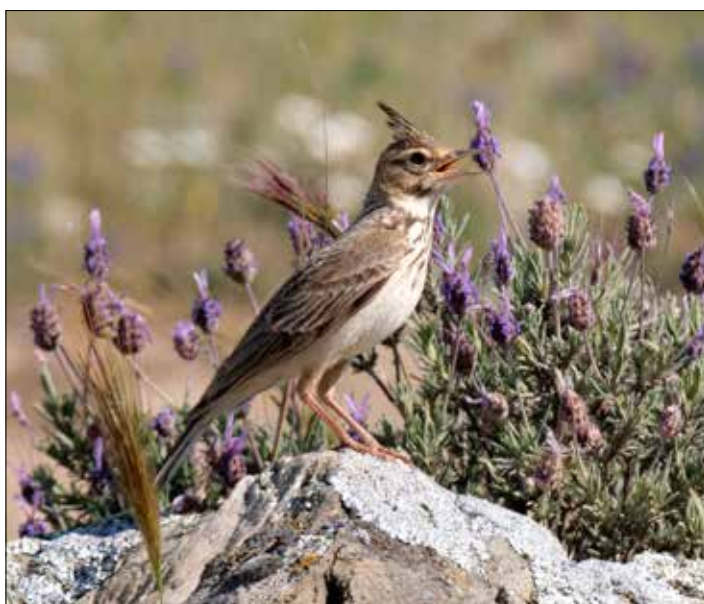
Cochevis huppé, Belchite