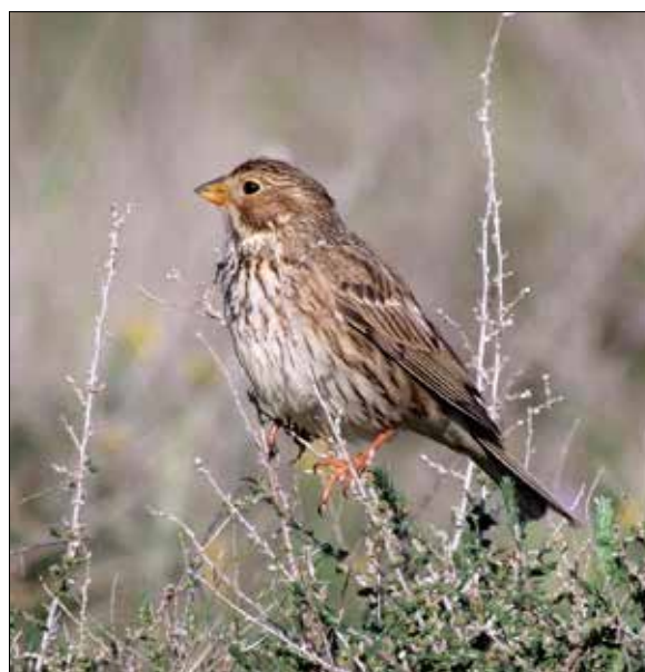
Bruant proyer, Belchite