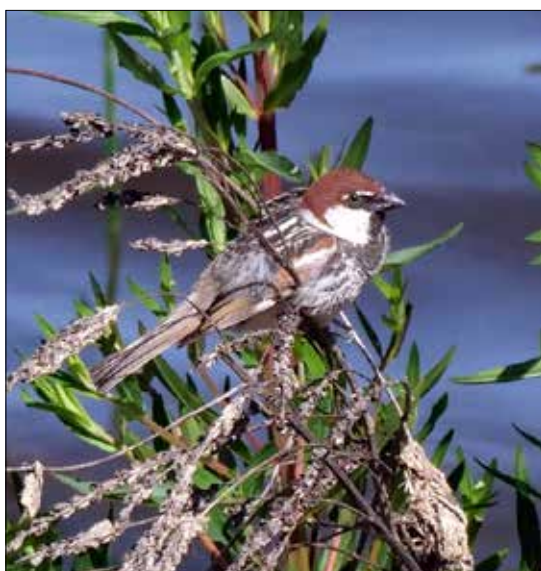
Moineau espagnol, Monfragüe