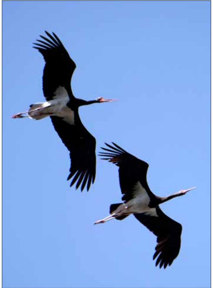
Cigognes noires, Monfragüe