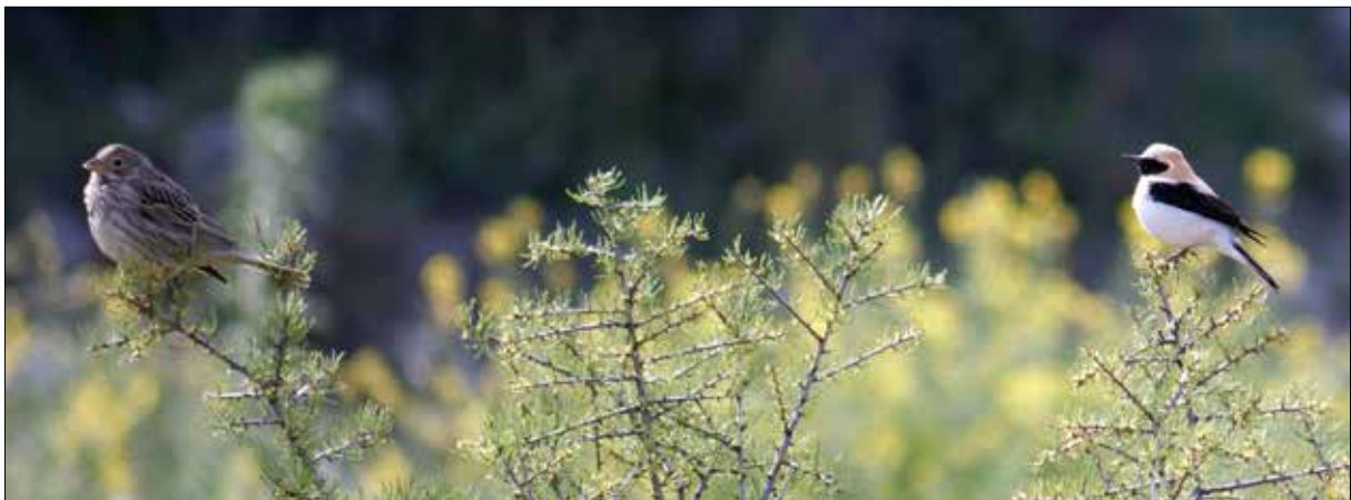
Bruant proyer et Traquet oreillard, Monégros