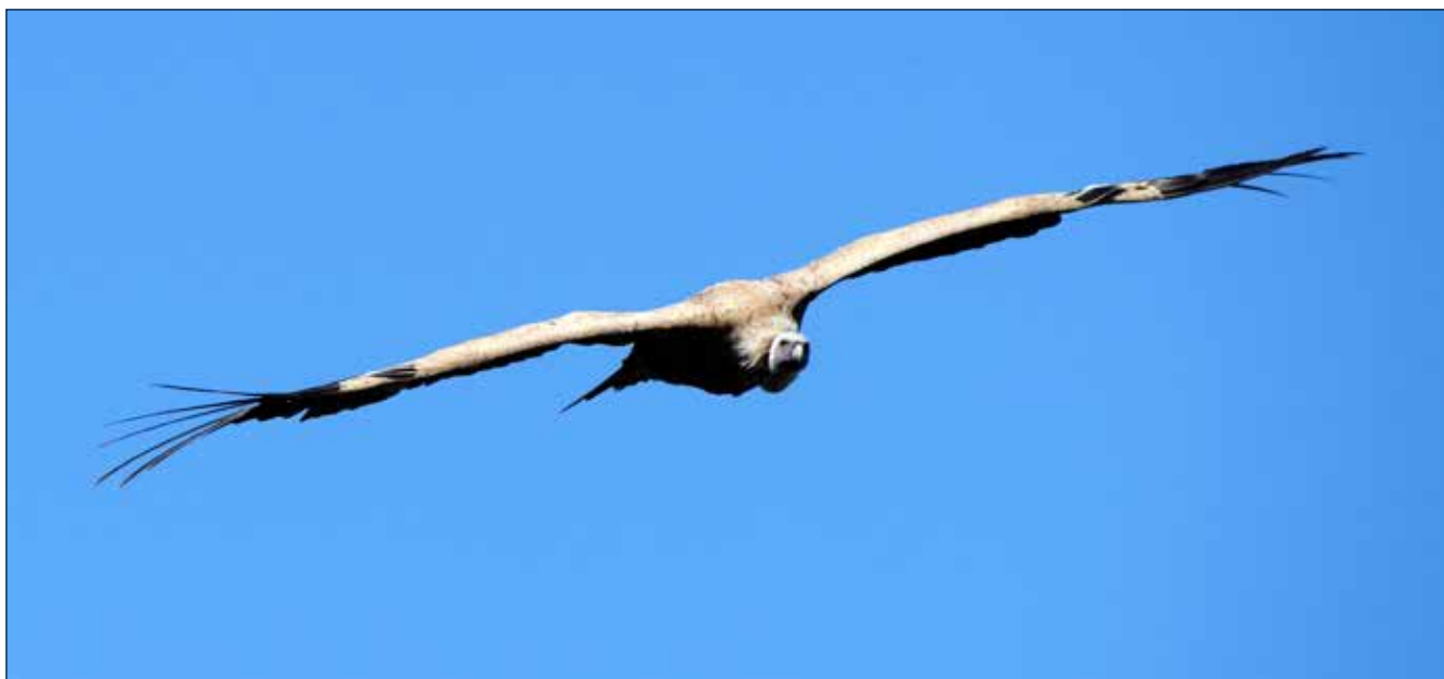
Vautour fauve, Riglos