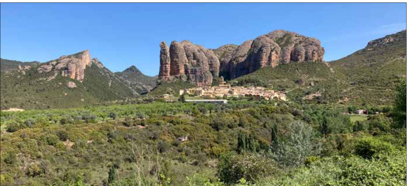
Los Mallos d'Agüero