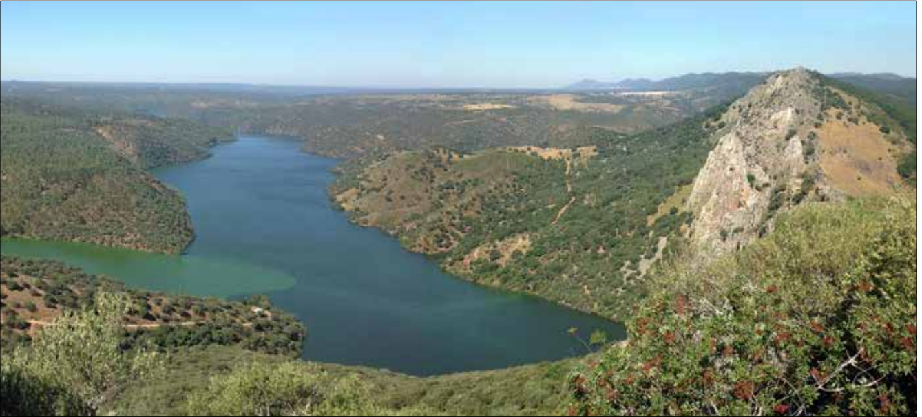
Le Tage et Peñafalcon, Monfragüe