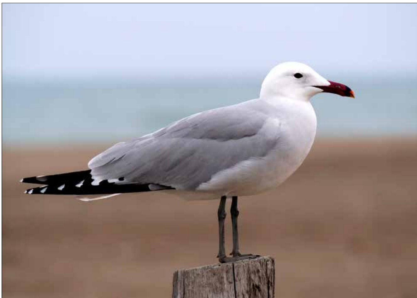
Goéland d'Audouin, delta de l'Èbre