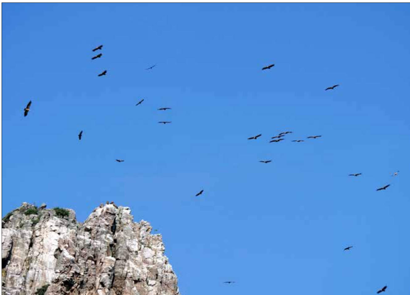
Ballet de vautours à Peñafalcon, Monfragüe