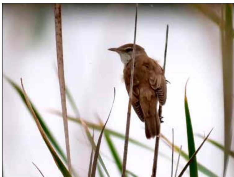
Rousserolle turdoïde, delta de l'Èbre