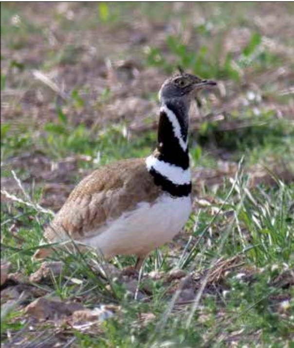
Outarde canepetière, Monégros