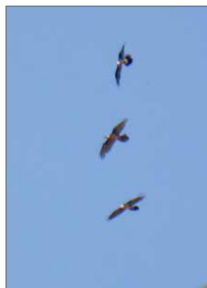
Gypaètes barbus, col du Pourtalet