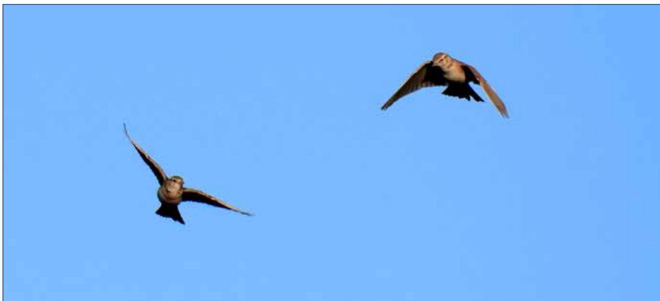
Alouettes calandrelles, Belchite