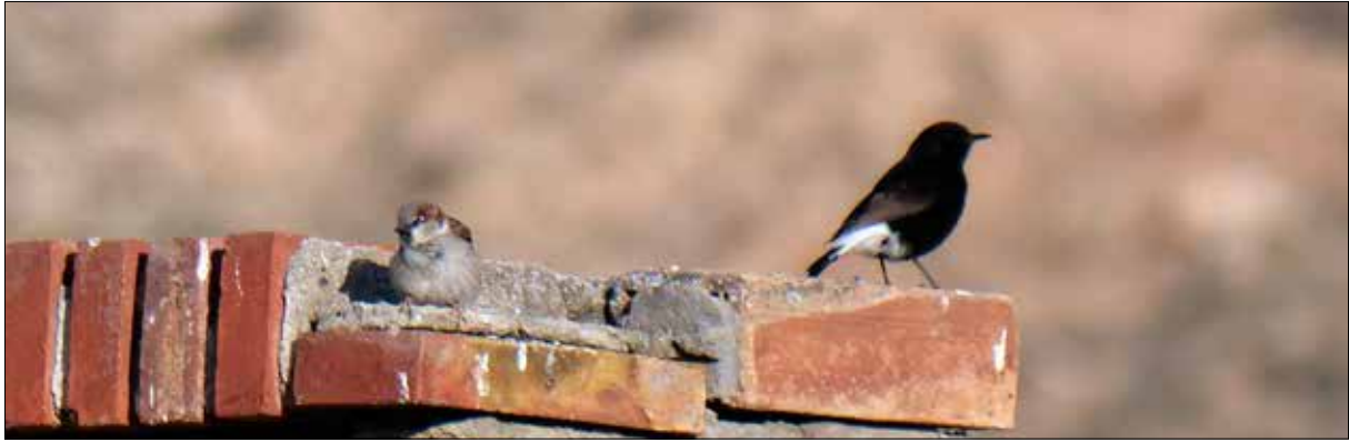
Moineau domestique et Traquet rieur, Monégros