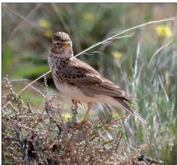
Alouette pispolette, Belchite