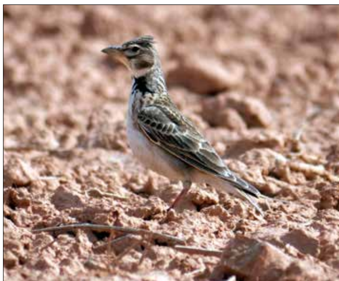
Alouette calandre, Belchite