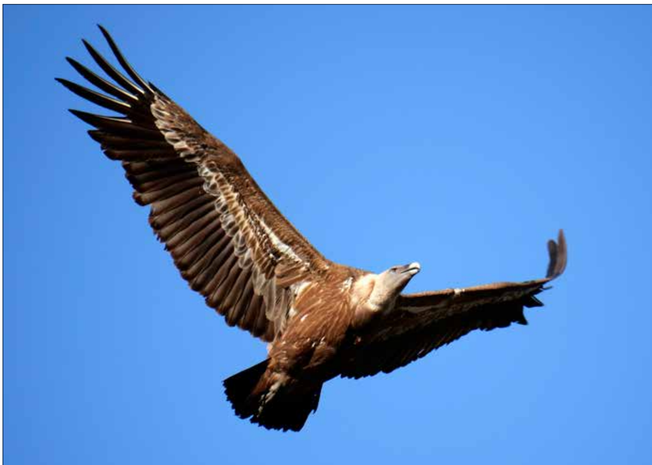
Vautour fauve, Monfragüe