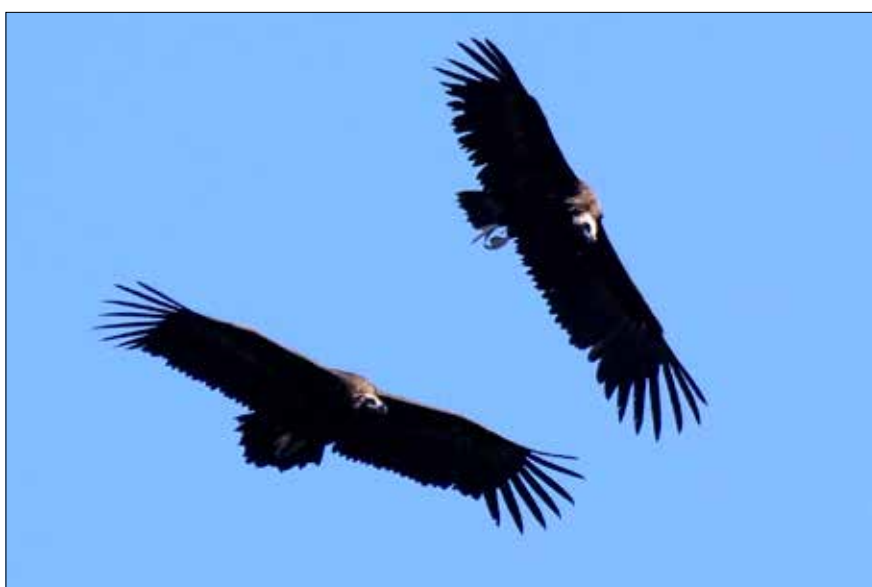
Vautours moines, Monfragüe