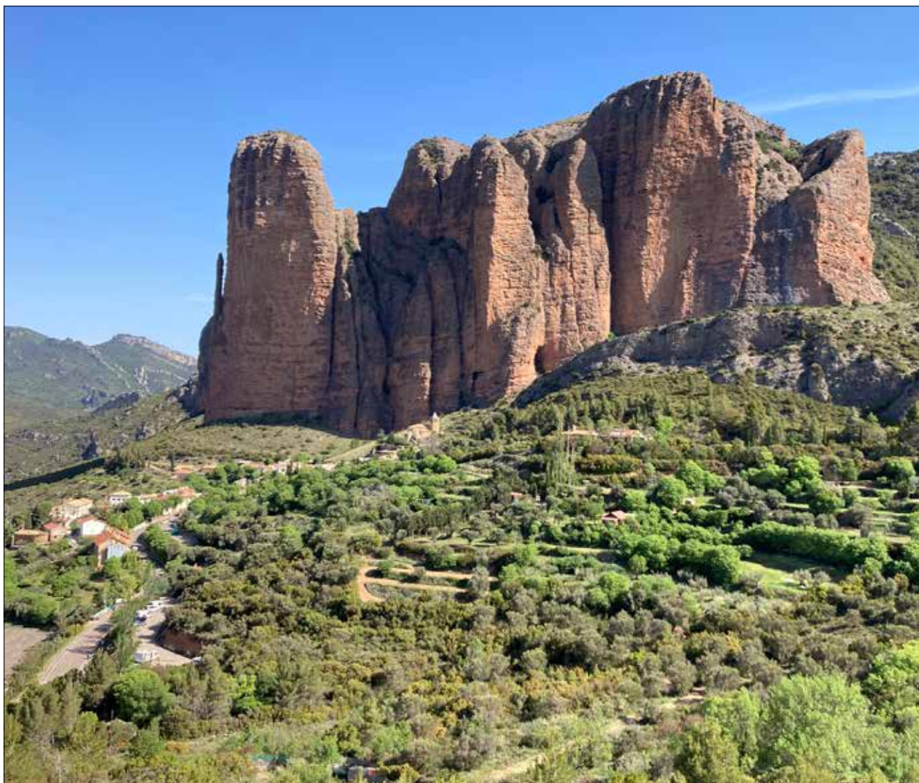
Los Mallos de Riglos