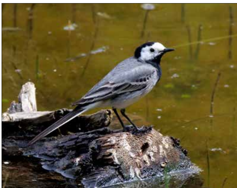
Bergeronnette grise, San Juan de la Peña