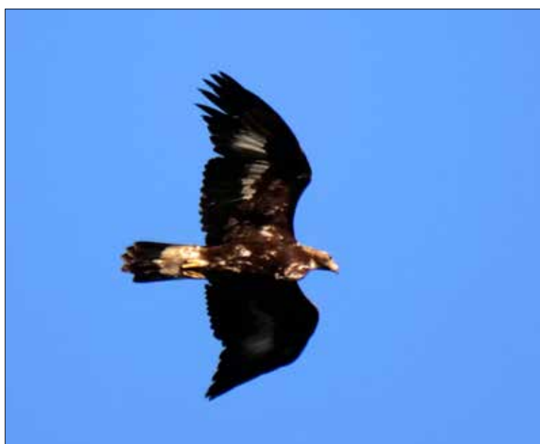
Aigle royal, Monégros