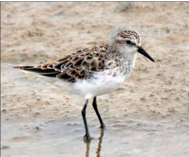
Bécasseau minute, delta de l'Èbre