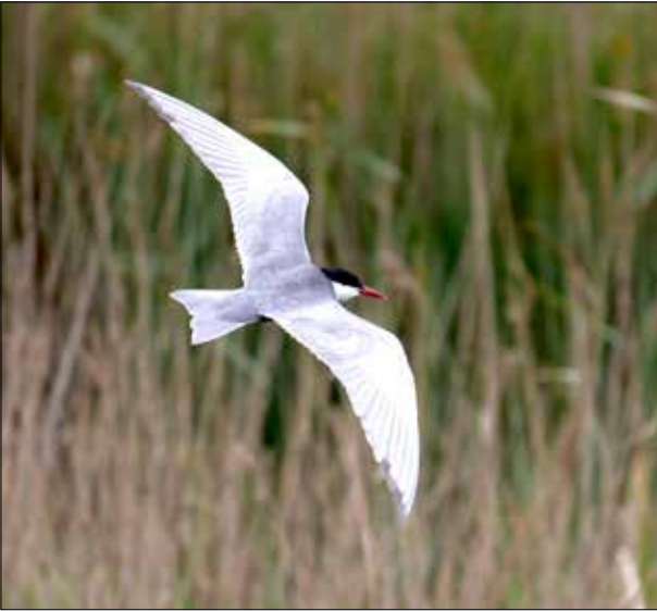
Guifette moustac, delta de l'Èbre