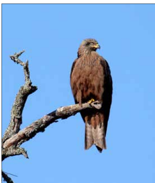
Milan noir, Monfragüe