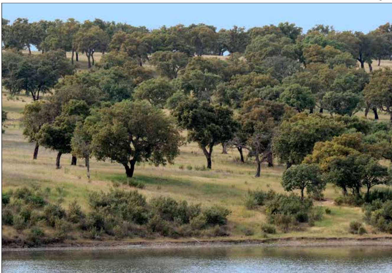
Chênaie à Monfragüe