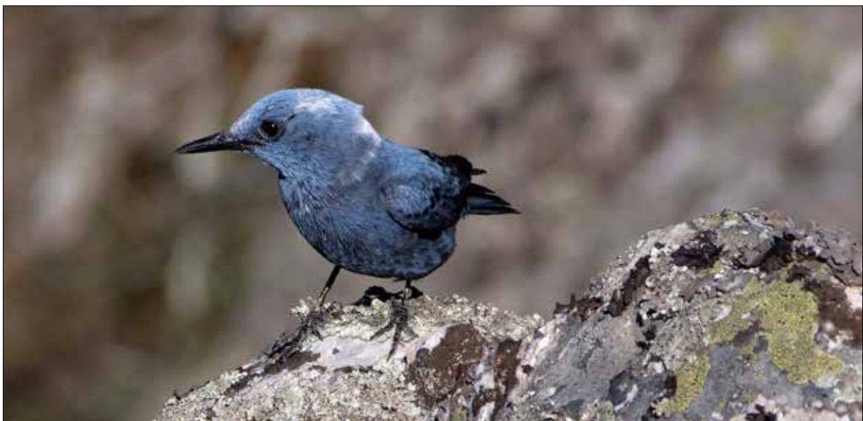
Monticole bleu, Monfragüe