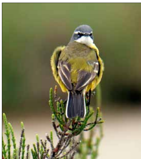
Bergeronnette printanière, delta de l'Èbre