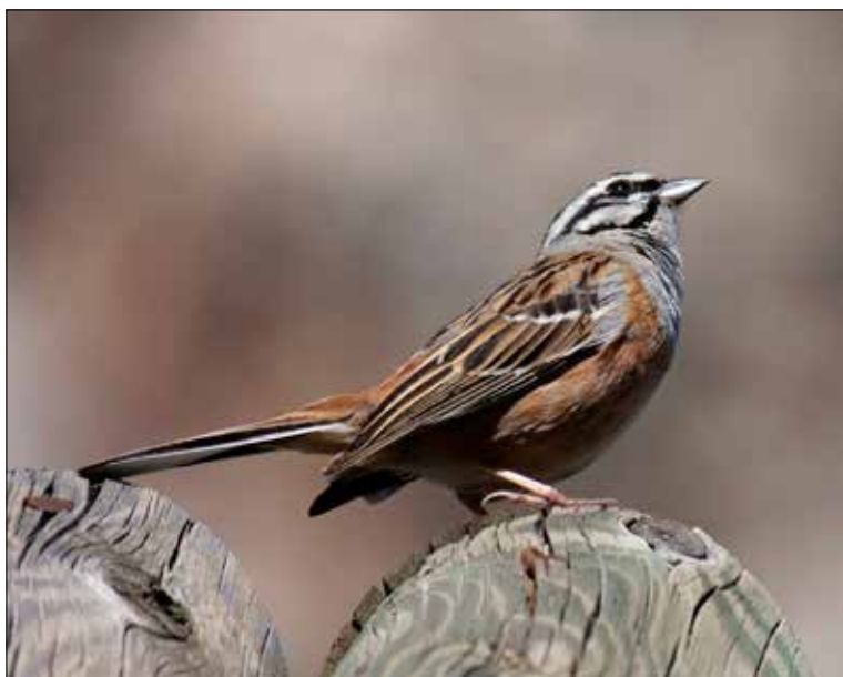
Bruant fou mâle, Monfragüe