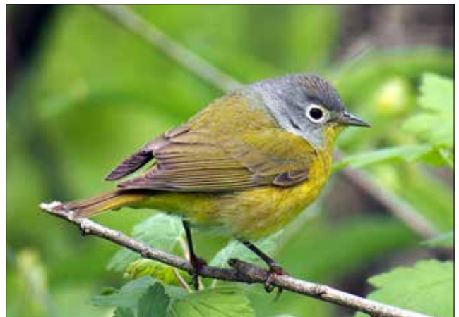
Paruline à joues grises, Point Pelee (MD)