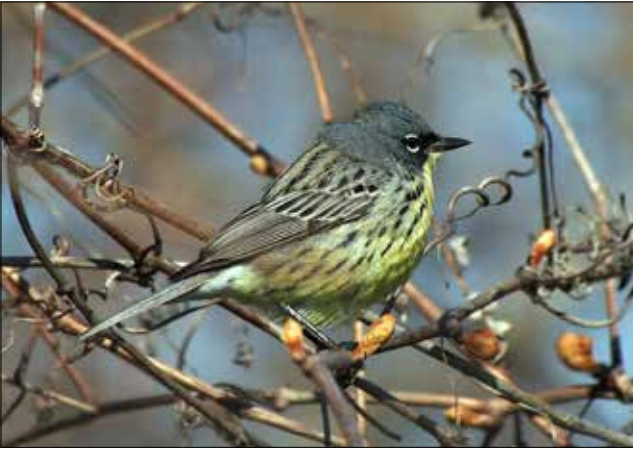
Paruline de Kirtland, Point Pelee (MD)