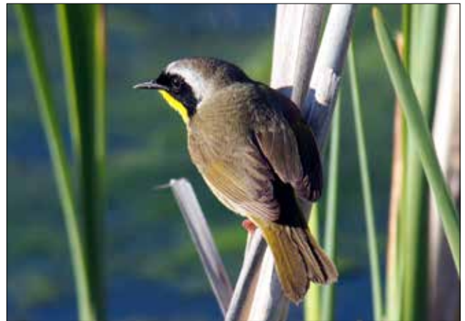
Paruline masquée, Point Pelee (MD)