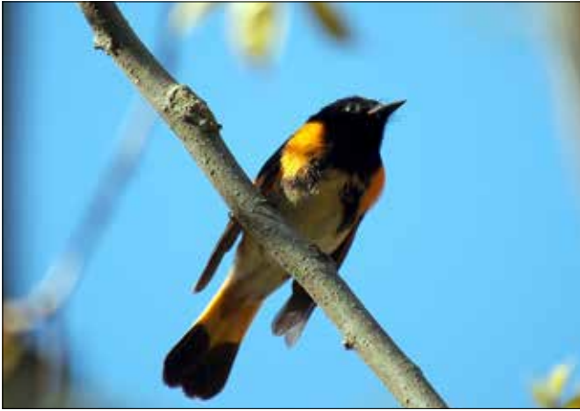
Paruline flamboyante, Point Pelee (MD)