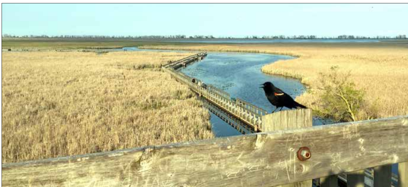
Carouge à épaulettes au Marais, Point Pelee (SD)