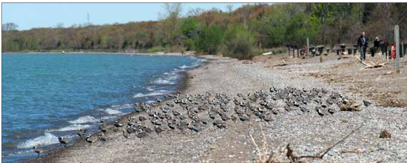
Pluviers argentés sur la West Beach, Point Pelee (MD)