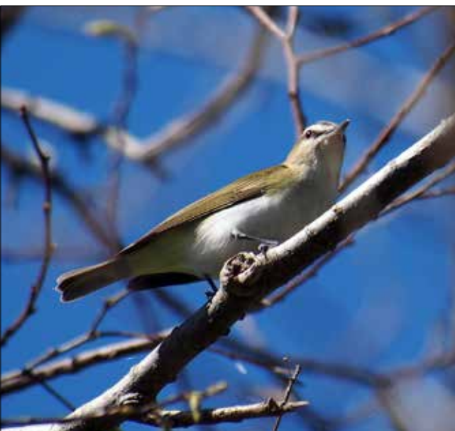
Viréo à œil rouge, Point Pelee (MD)