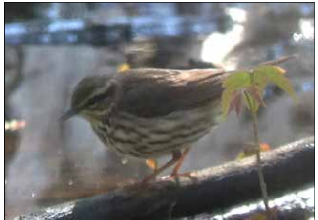
Paruline des ruisseaux, Point Pelee (MD)