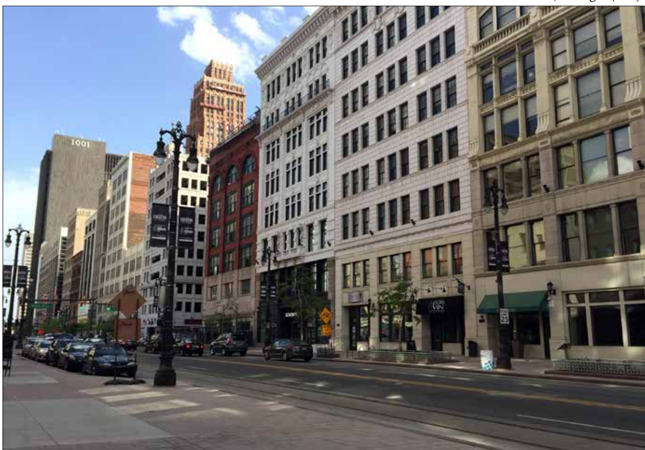
Detroit, Michigan (MD)