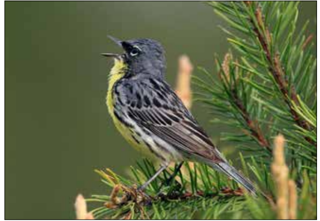
Paruline de Kirtland, Hartwick Pines (JO)