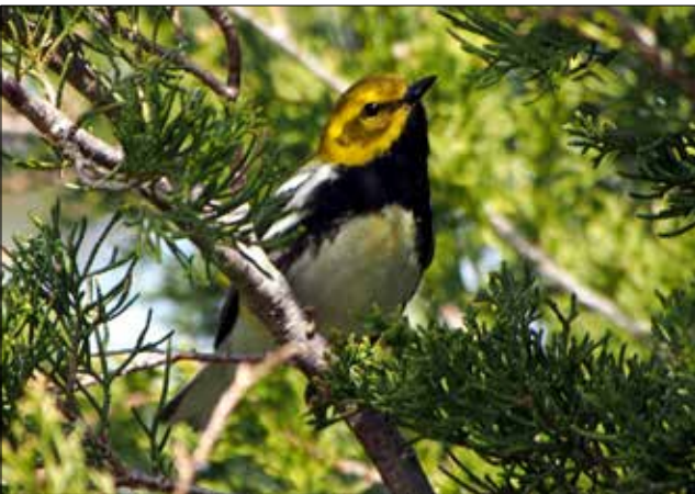
Paruline à gorge noire, Point Pelee (MD)