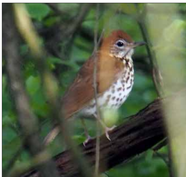
Grive des bois, Point Pelee (MD)