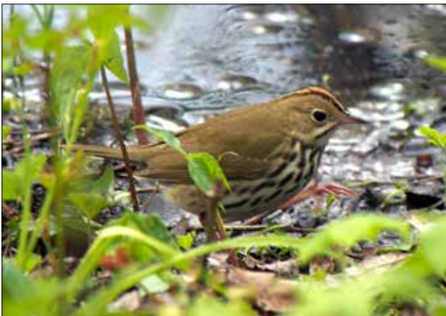
Paruline couronnée, Point Pelee (MD)