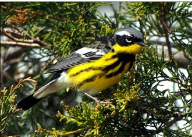
Paruline à tête cendrée, Point Pelee (MD)