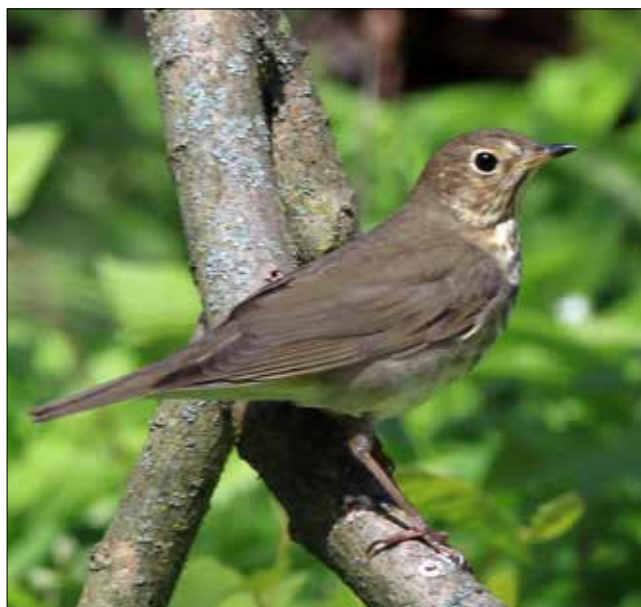
Grive à joues grises, Point Pelee (JO)