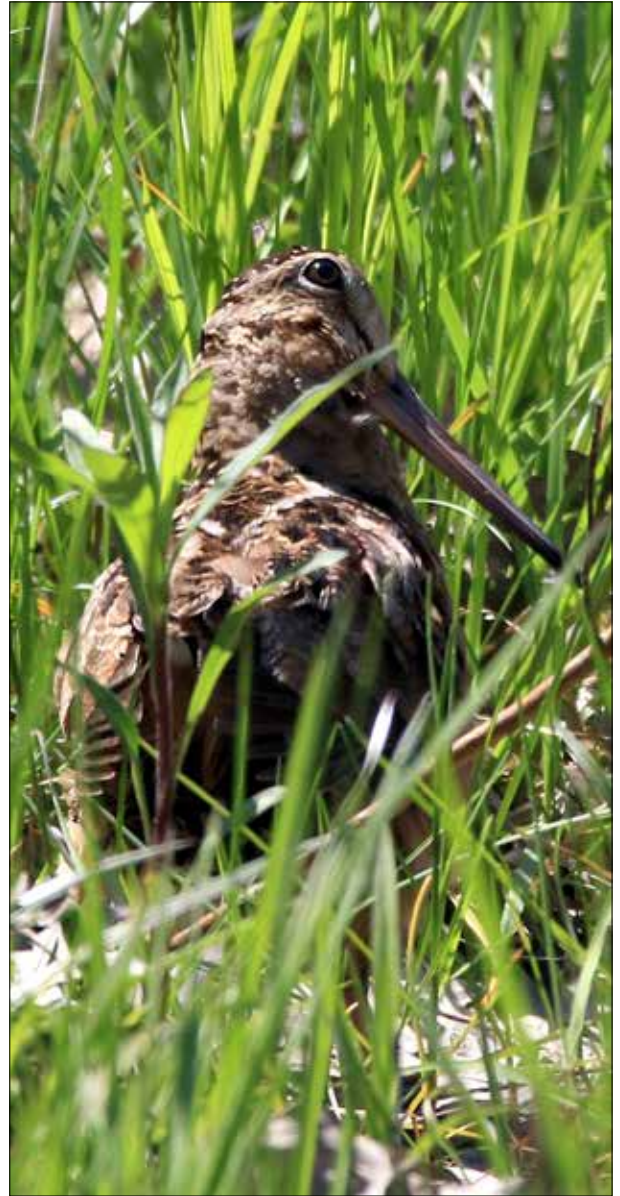
Bécasse d'Amérique, Hillman Marsh (JO)