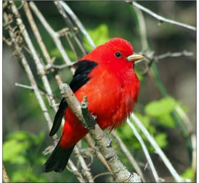
Piranga écarlate, Point Pelee (MD)