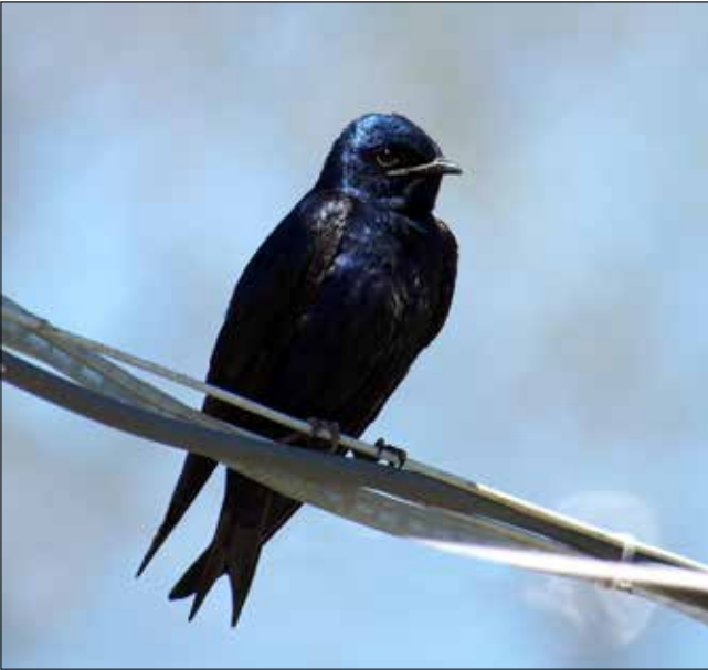
Hirondelle noire, Point Pelee (MD)