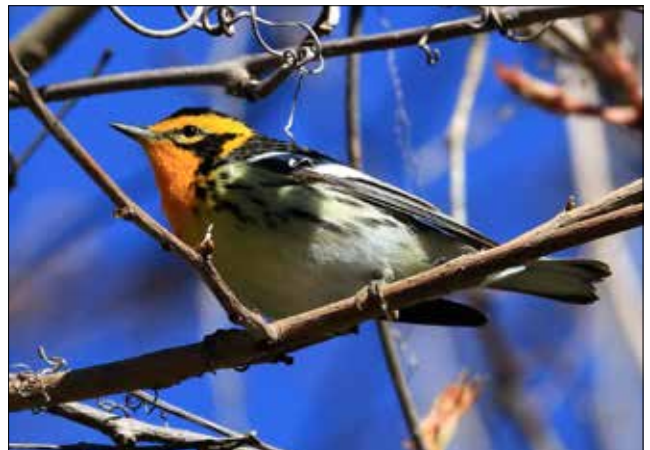
Paruline à gorge orangée, Point Pelee (JO)