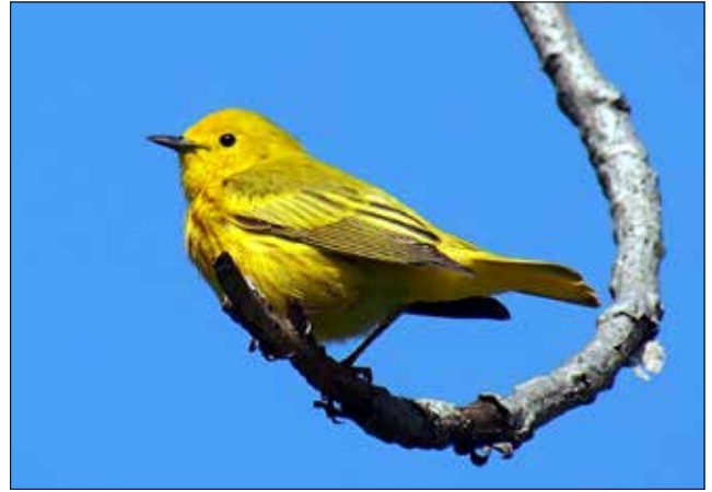
Paruline jaune, Point Pelee (MD)