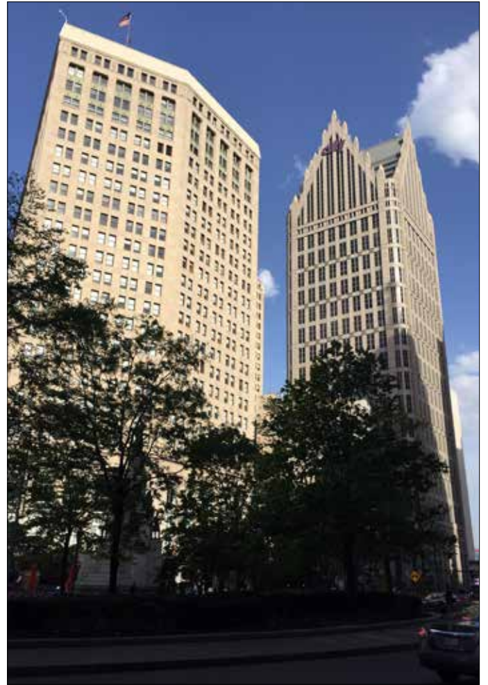
Detroit, Michigan (MD)