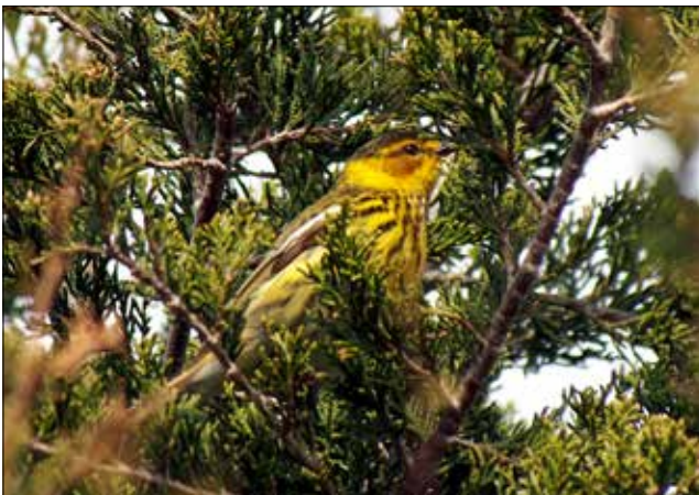
Paruline tigrée, Point Pelee (MD)