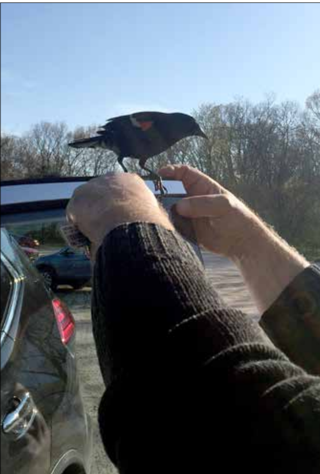
Carouge à épaulettes, Marais, Point Pelee (SD)