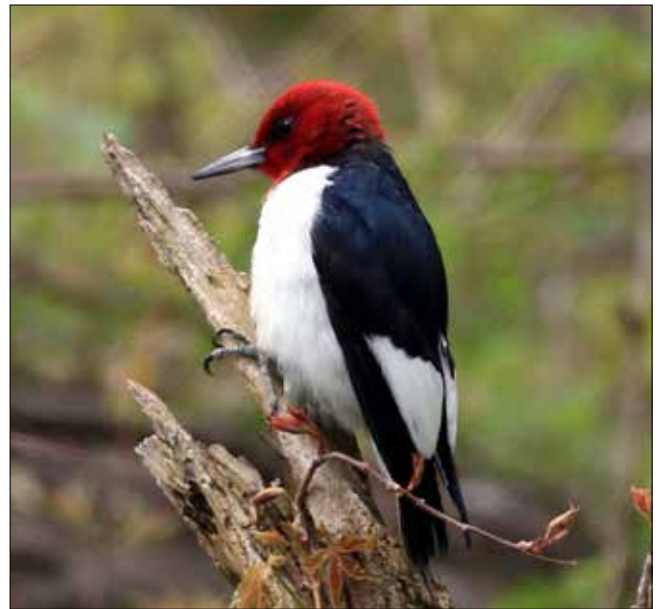
Pic à tête rouge, Point Pelee (MD)