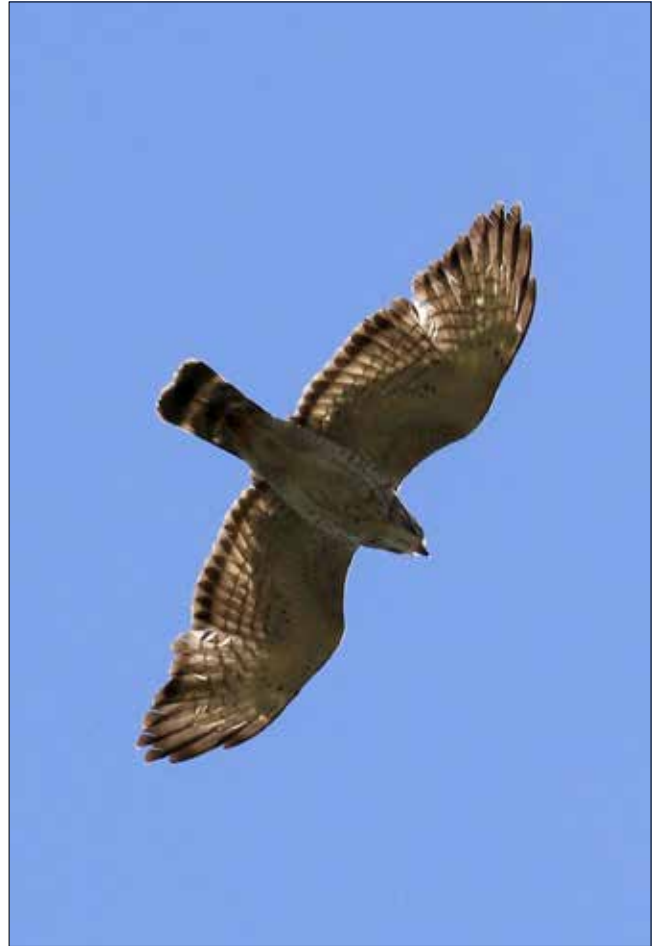
Petite Buse, Point Pelee (JO)