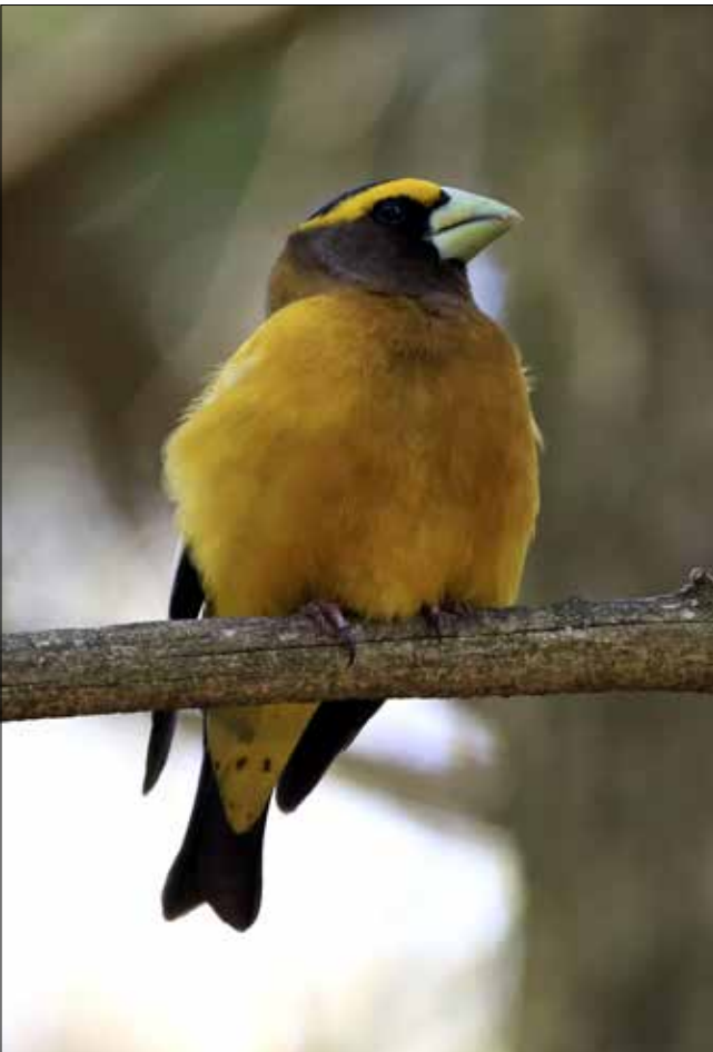
Grosbec errant mâle, Hartwick Pines (JO)