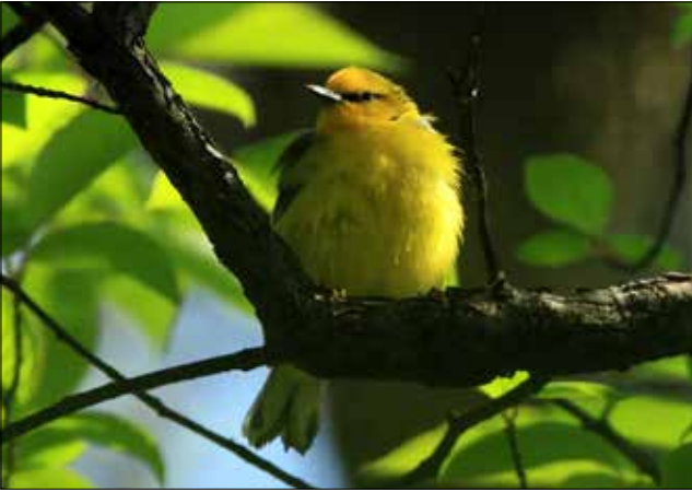
Paruline à ailes bleues, Point Pelee (JO)