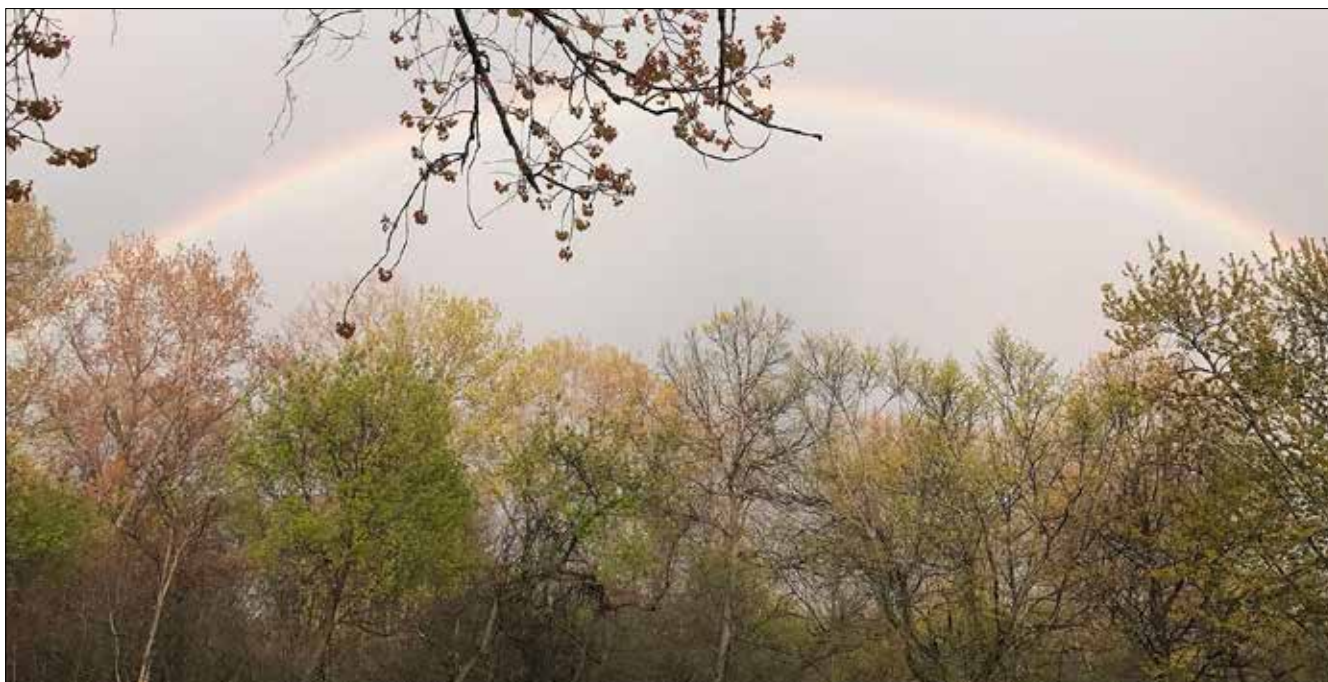
Arc-en-ciel au-dessus des parulines, Point Pelee (JO)