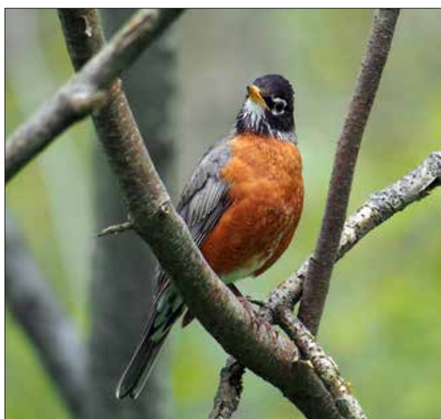
Merle d'Amérique, Point Pelee (MD)