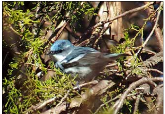
Paruline azurée, Point Pelee (MD)