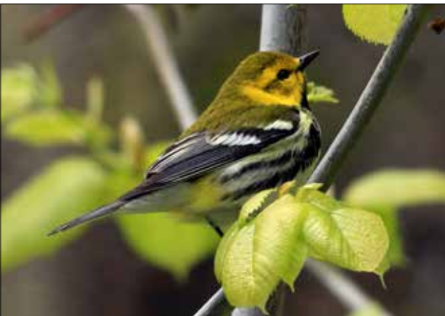
Paruline à gorge noire, Point Pelee (JO)