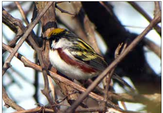
Paruline à flancs marron, Point Pelee (MD)