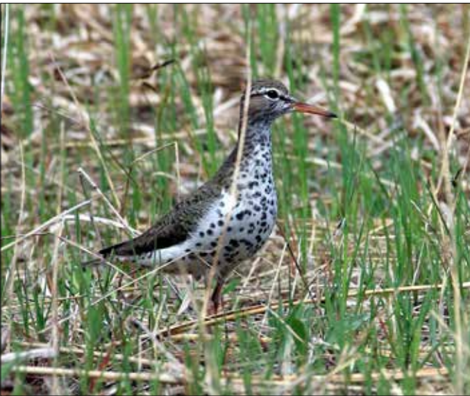
Chevalier grivelé, Wakeley Lake (JO)