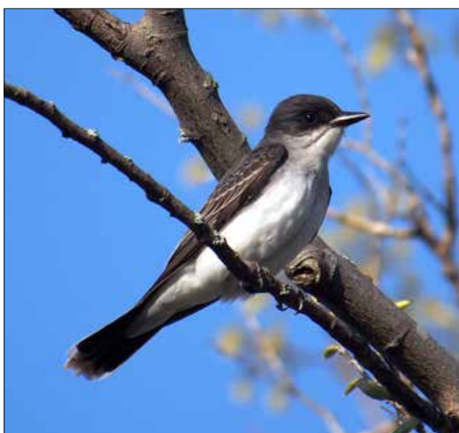
Tyran tritri, Point Pelee (MD)