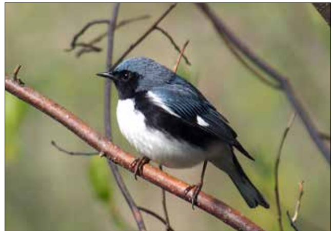
Paruline bleue, Point Pelee (MD)