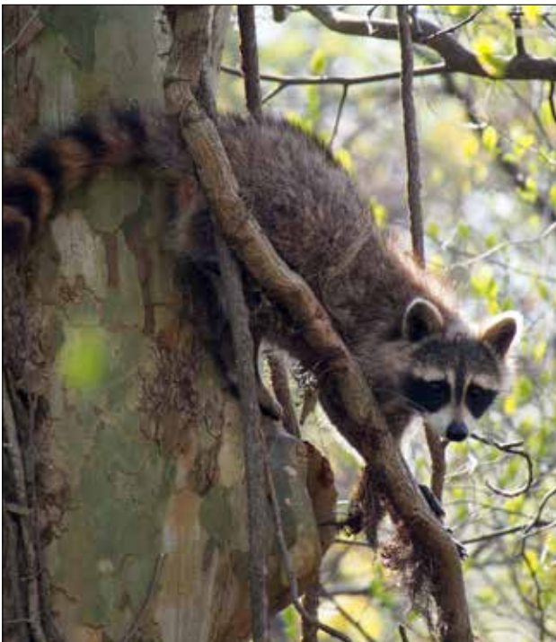
Raton laveur, Point Pelee (MD)