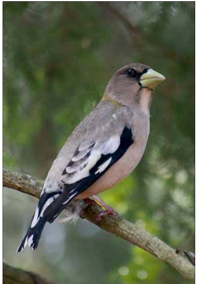
Grosbec errant femelle, Hartwick Pines (MD)