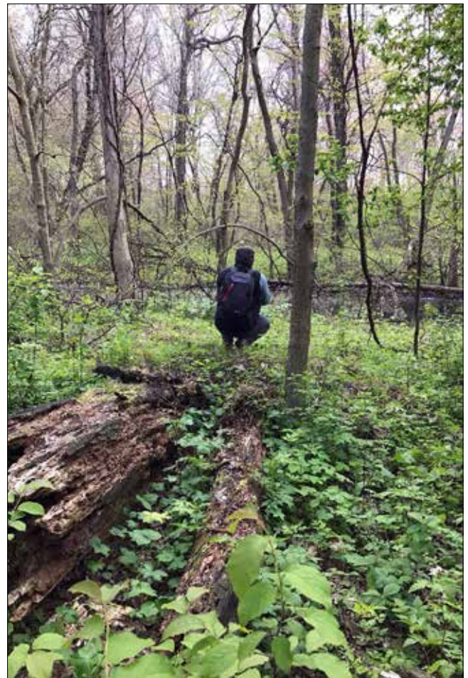
MD photographie une Paruline couronnée, Point Pelee (JO)