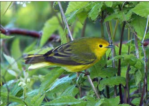
Paruline jaune, Point Pelee (MD)