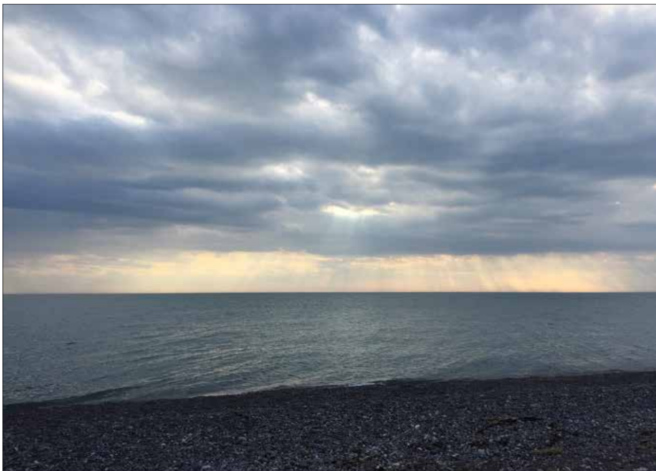
Lac Érié, Point Pelee (SD)