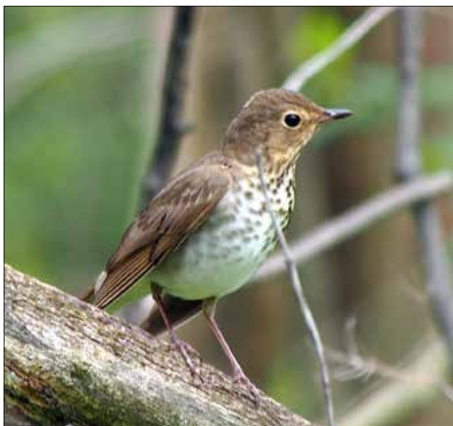
Grive à dos olive, Point Pelee (MD)