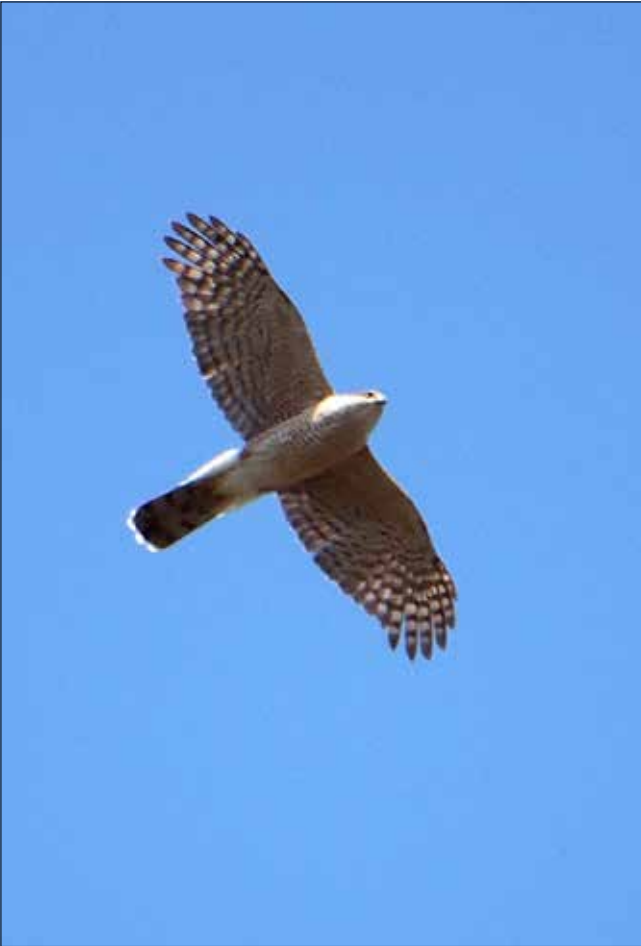
Épervier brun mâle, Point Pelee (MD)