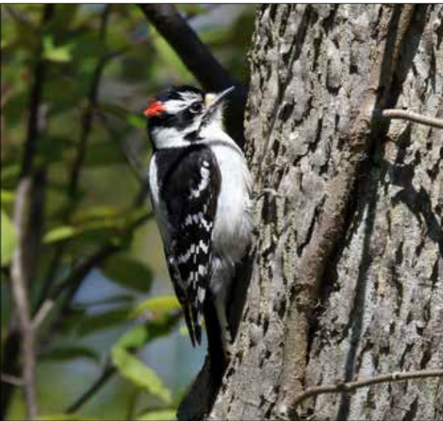
Pic mineur, Point Pelee (JO)