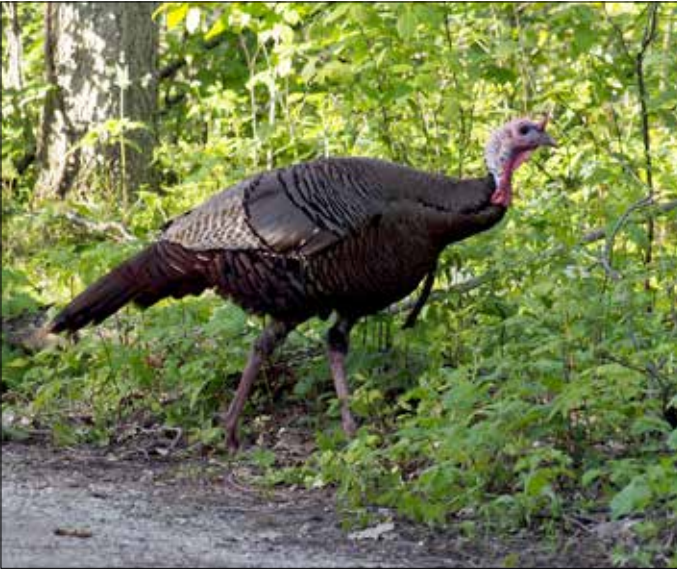
Dindon sauvage mâle, Point Pelee (MD)