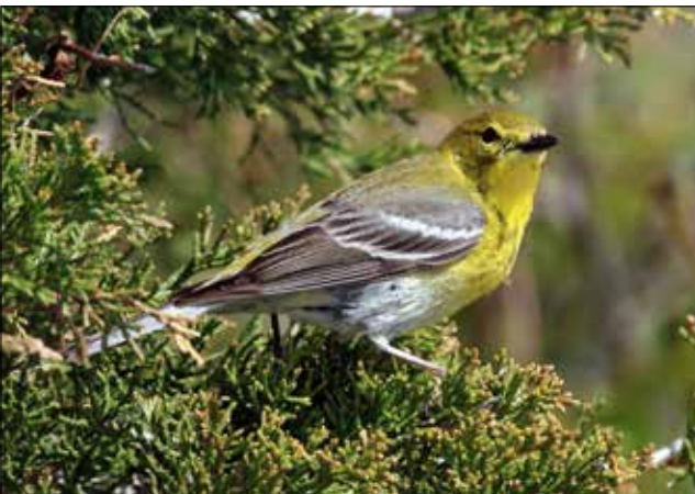
Paruline des pins, Point Pelee (JO)