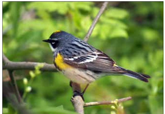
Paruline à croupion jaune, Point Pelee (MD)