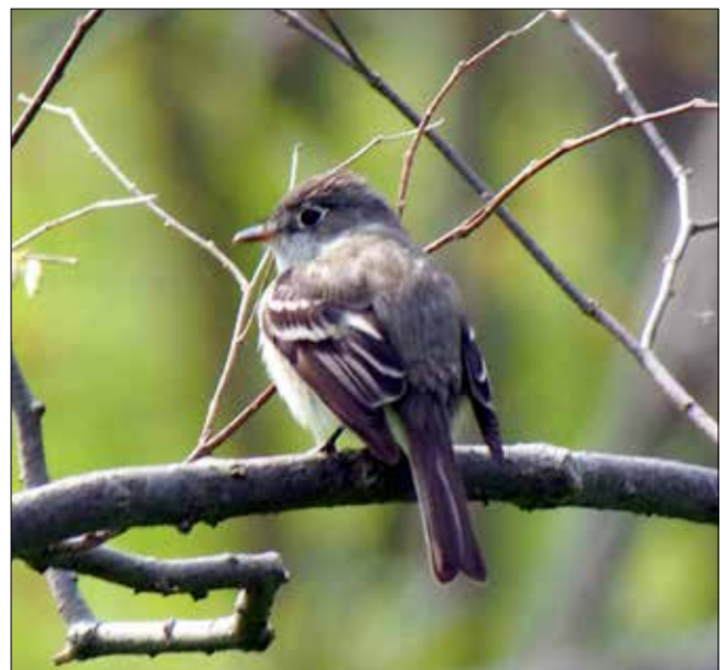
Moucherolle sp. (des saules?), Point Pelee (MD)