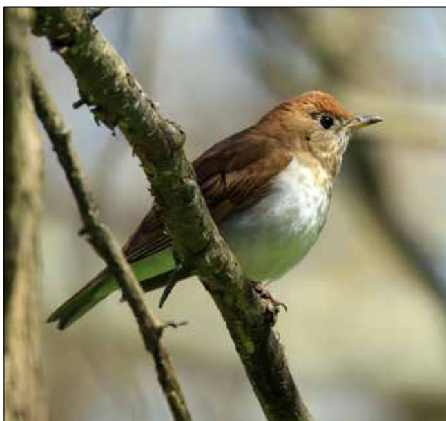
Grive fauve, Point Pelee (JO)