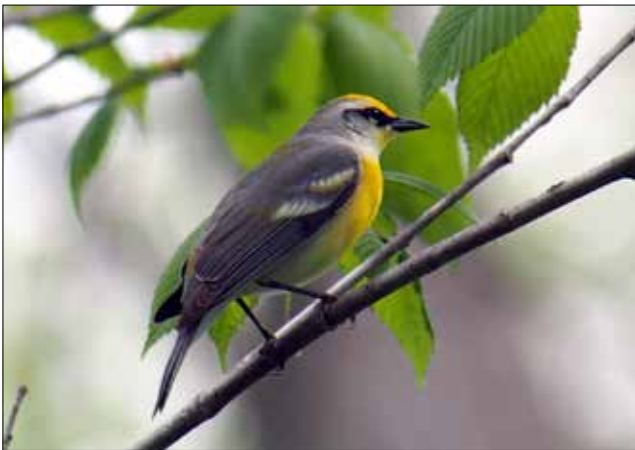
Paruline « de Brewster », Point Pelee (MD)