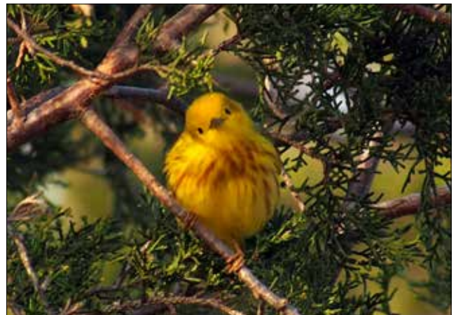
Paruline jaune, Point Pelee (MD)