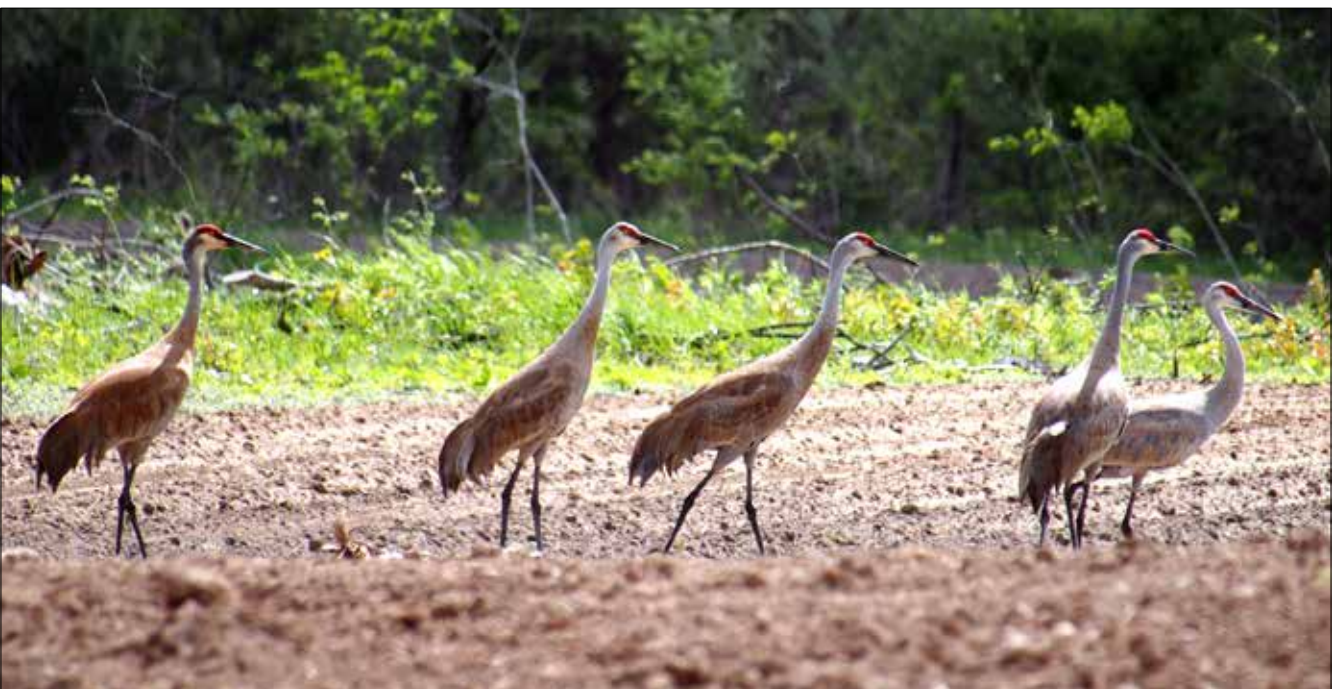
Grues du Canada, Northern Bay County (MD)