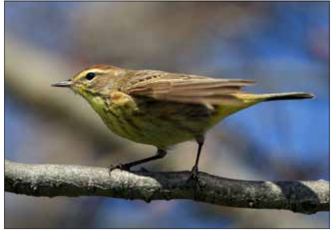
Paruline à couronne rousse, Point Pelee (JO)