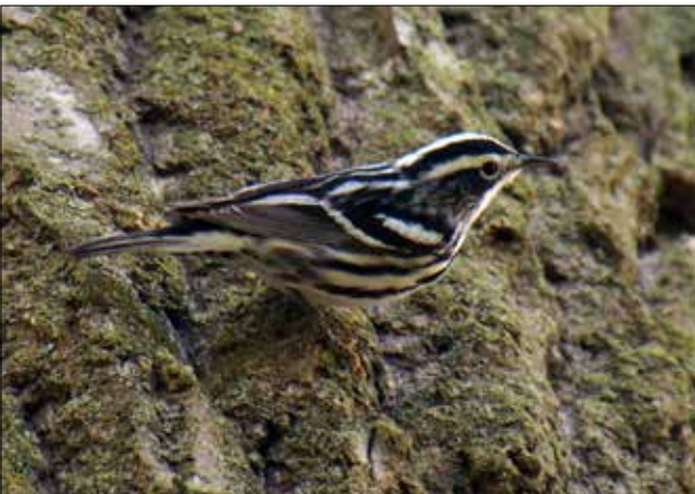
Paruline noir et blanc, Point Pelee (MD)