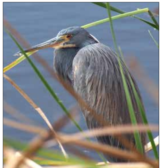
Hérons, hérons petit, pas tapons !