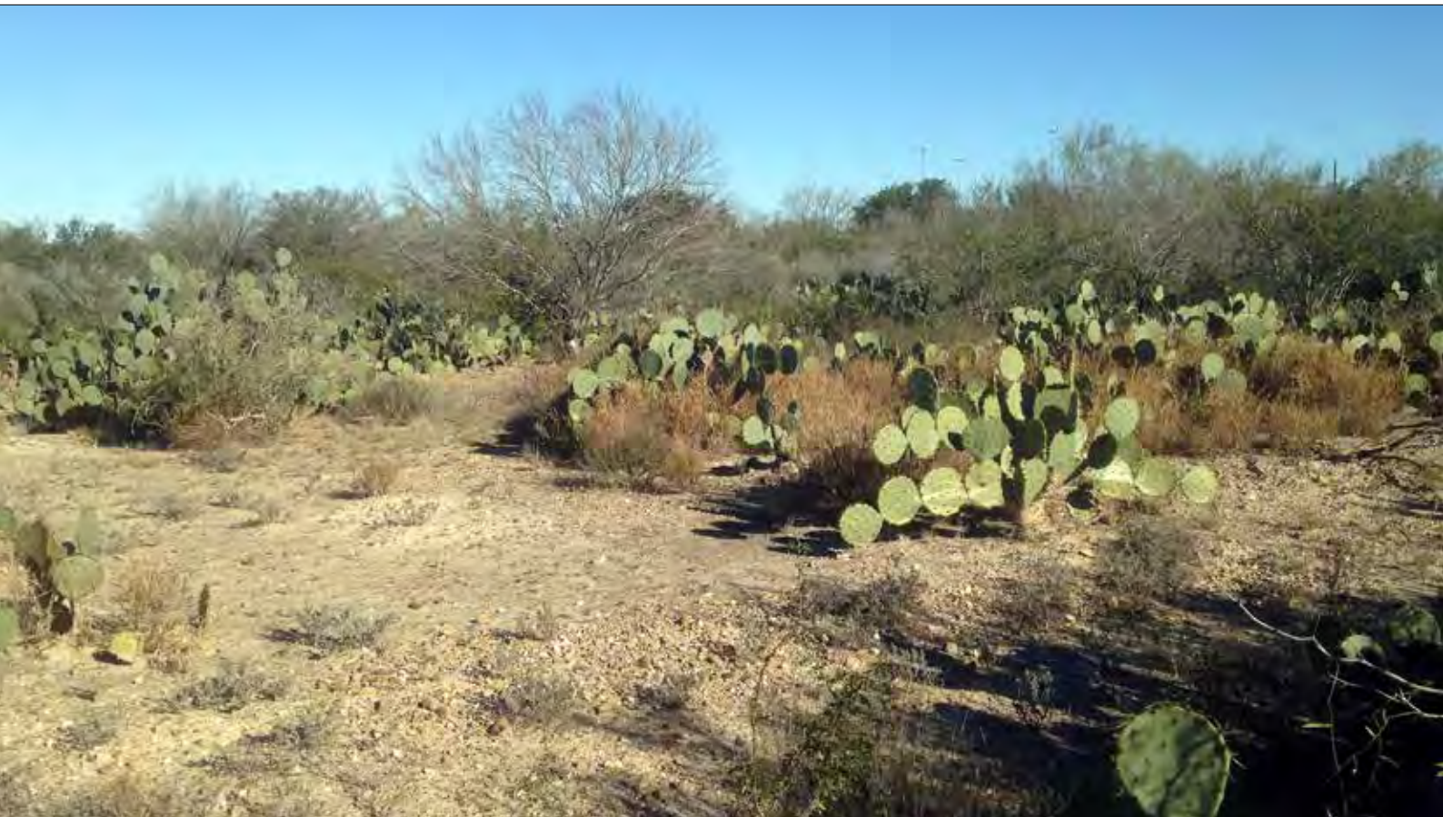
Habitat du Troglodyte des cactus, Salineño

Photos de couverture: Faucon des prairies et Lynx roux