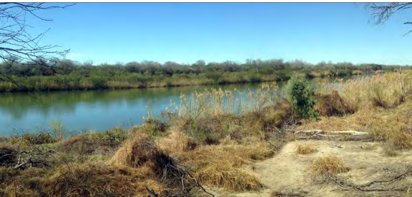
Le Rio Grande à Salineño

Total : 176 espèces observées (en 9 jours)