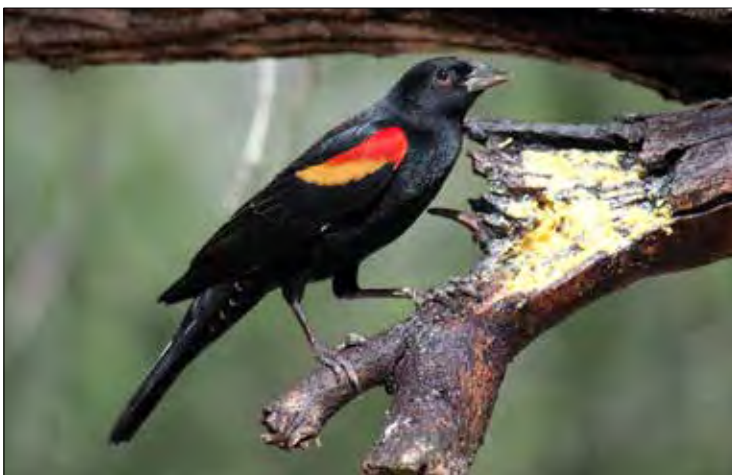
On aime le beurre de cacahuètes à Salineño !