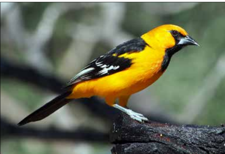
Parulines et orioles...