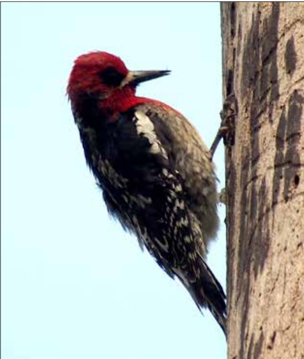
Pic à poitrine rouge, Elwha River (MD)