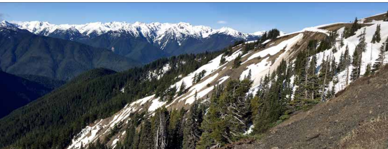
Parc National du Mont Olympic (SD)

Photos de couverture : Grive à collier (© Sam Barone) et Chevalier errant (© Tom Middleton)