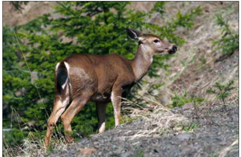
Cerf mulet à queue noire, PN du Mont Olympic