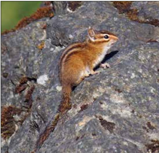
Tamias de Townsend , PN du Mont Olympic (MD)