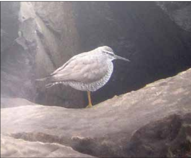
Chevalier errant, North Jetty, Ocean Shores (MD)