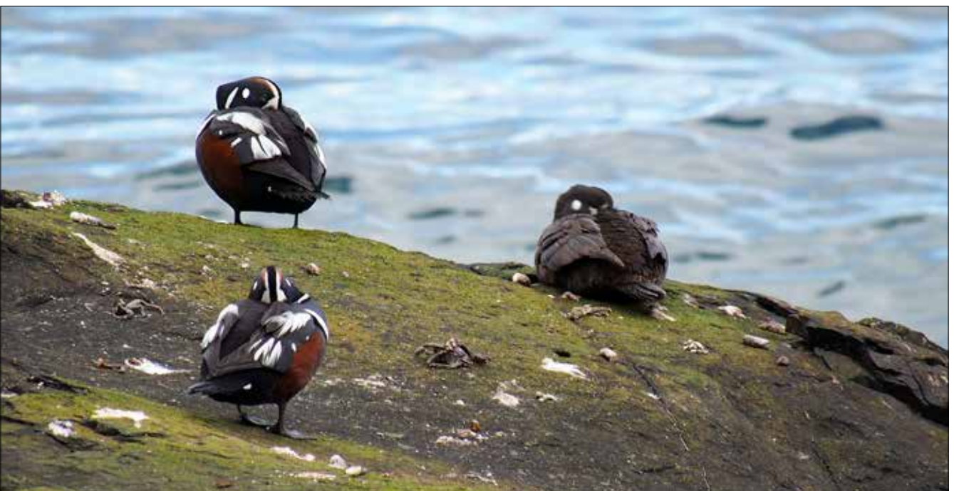
Arlequins plongeurs, Clallam Bay (MD)