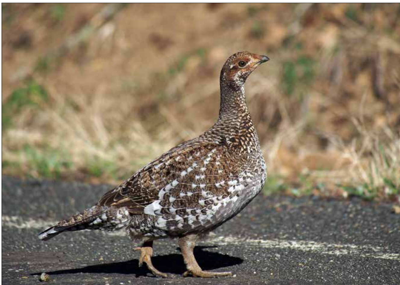
Tétras fuligineux femelle, PN du Mont Olympic (MD)