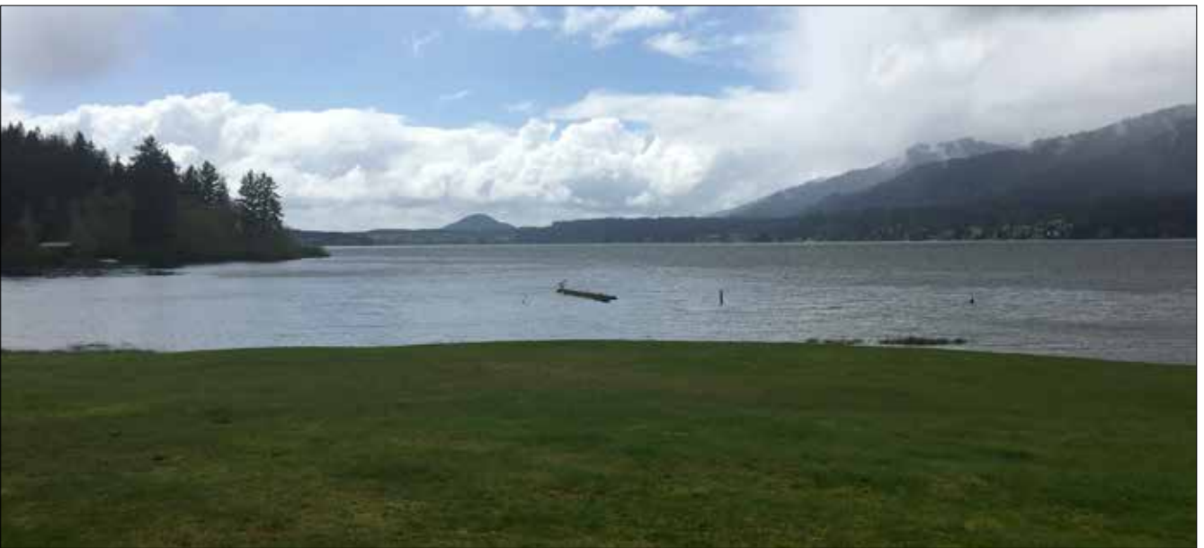
Lake Quinault (SD)