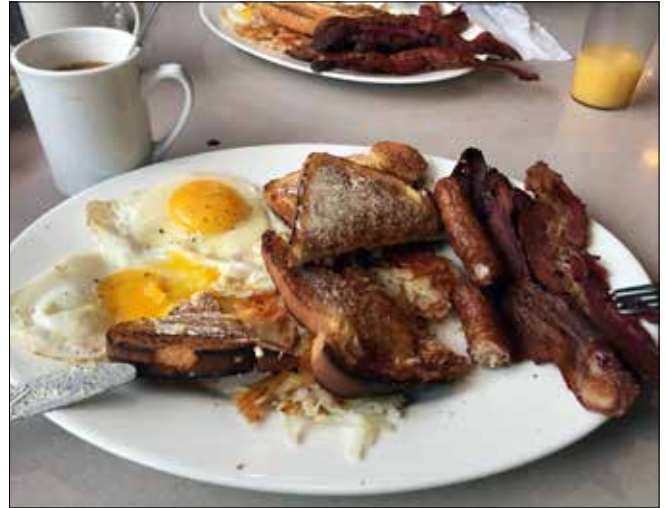
...grâce à un petit-déjeuner diététique ! (SD)