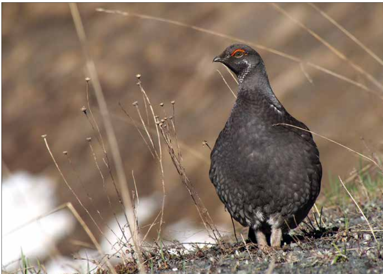
Tétras fuligineux mâle, PN du Mont Olympic (MD)