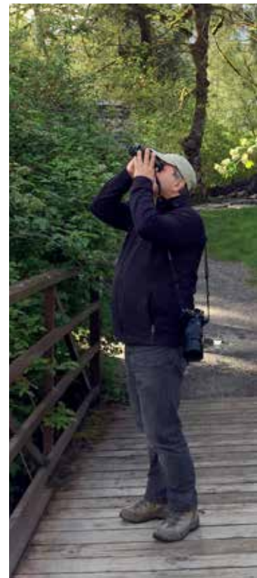
Coche de la Paruline grise au Lake Quinault (SD)