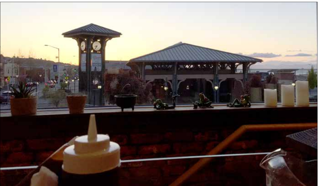
Port Angeles vu du Coyote BBQ Pub(SD)