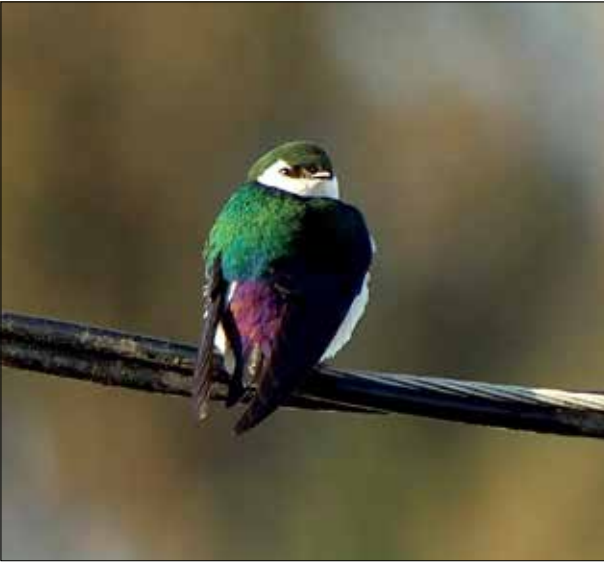
Hirondelle à face blanche, Forks (MD)