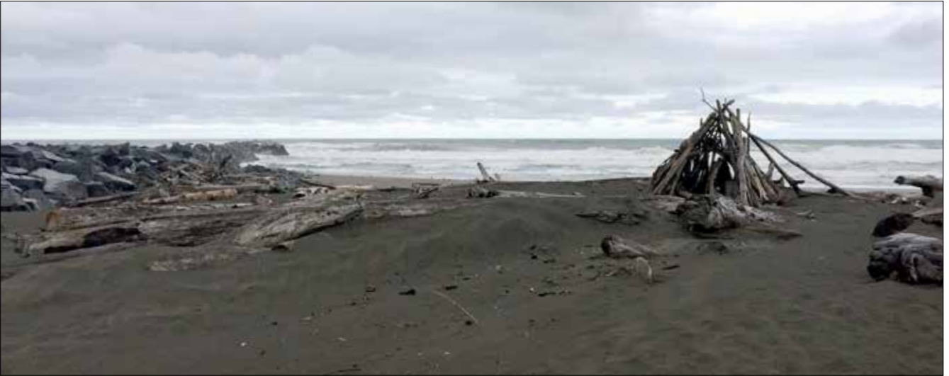
North Jetty, Ocean Shores (SD)