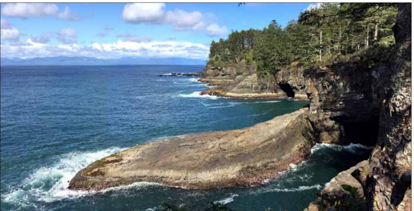
Cape Flattery (SD)