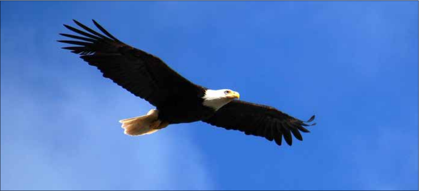
Pygargue à tête blanche, Neah Bay (MD)