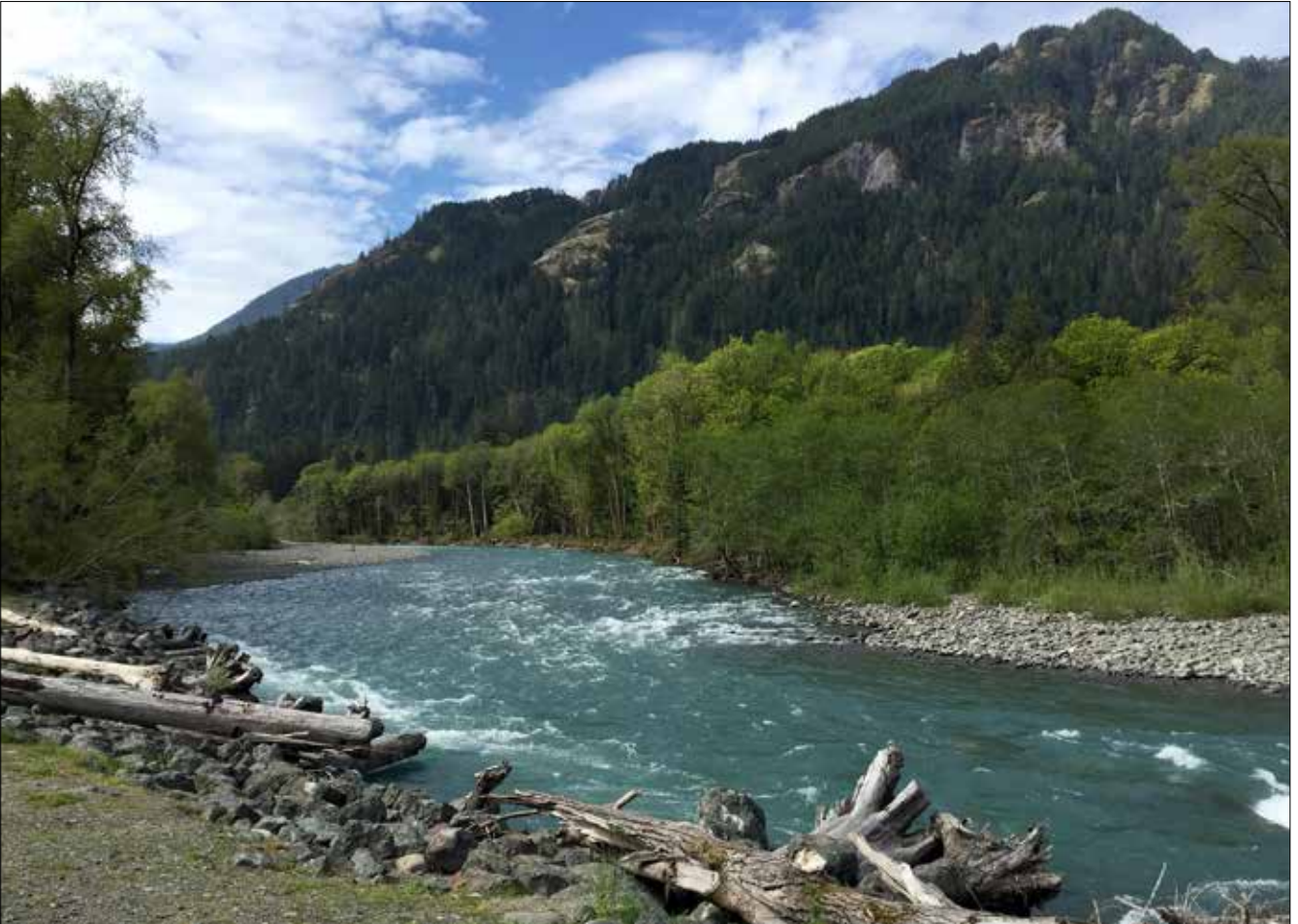
Elwha River (MD)