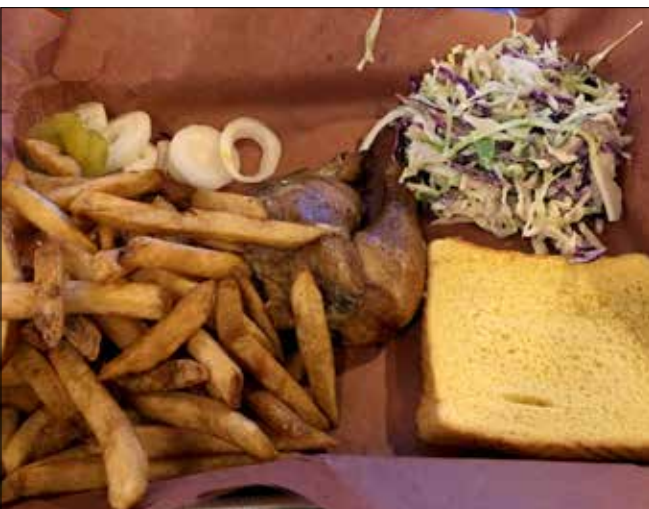
Chicken pour MD au Coyote BBQ Pub, Port Angeles (SD)