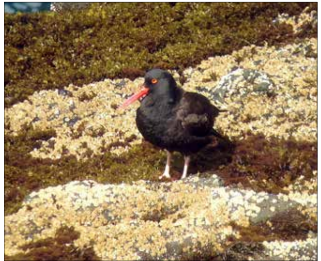
Huîtrier de Bachman, Cape Flattery (MD)