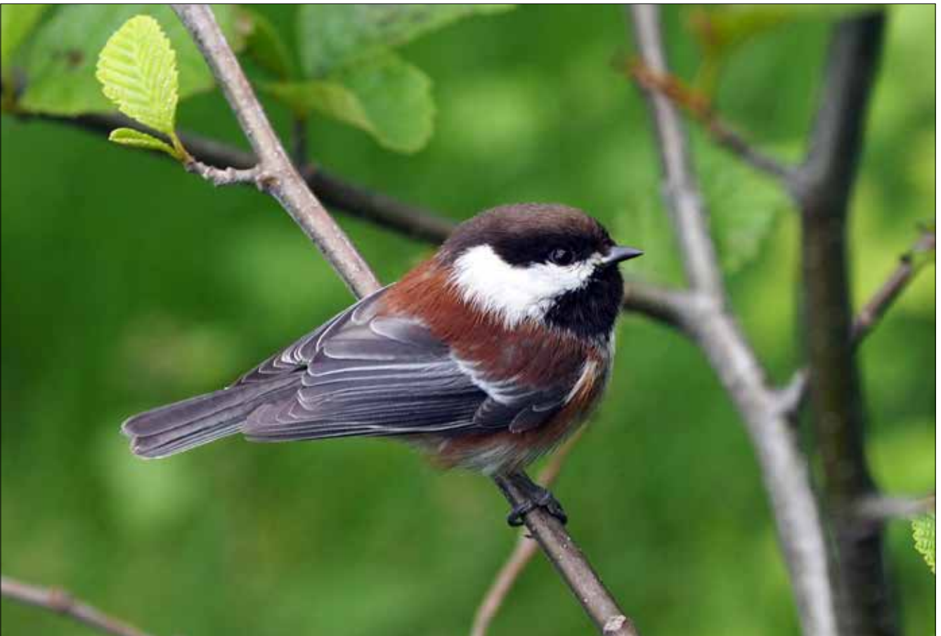
Mésange à dos marron, Elwha River Mouth (MD)