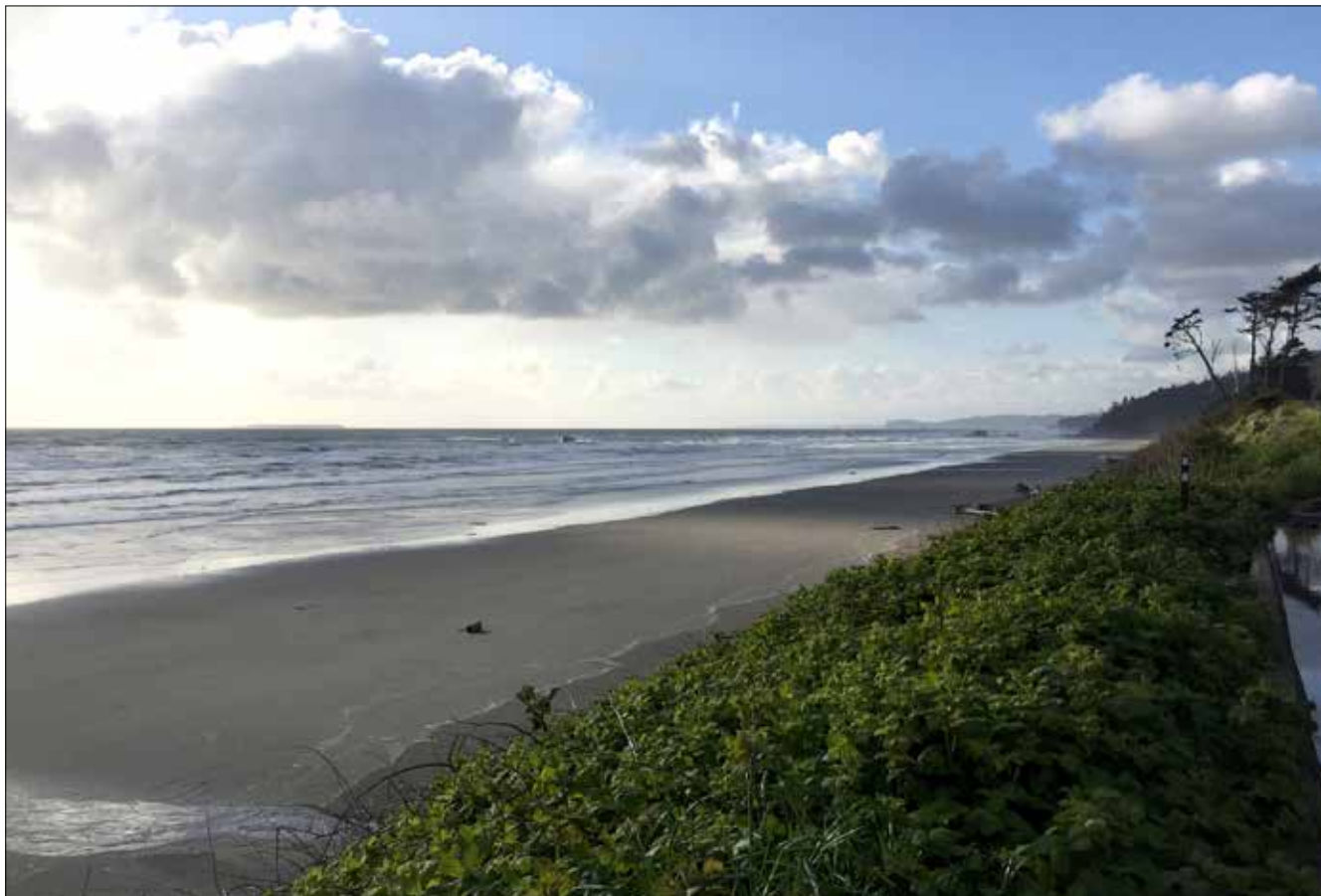
Plage de la côte pacifique, Clallam Bay (SD)