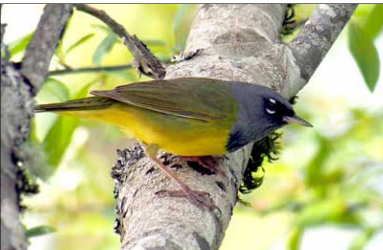
Paruline des buissons, Sandy Shore Lake Road, Quilcene (MD)