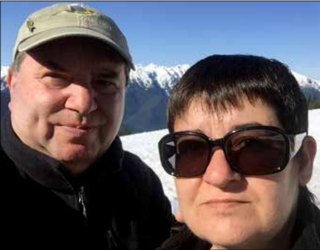
0°C au sommet du Mont Olympique et même pas froid...