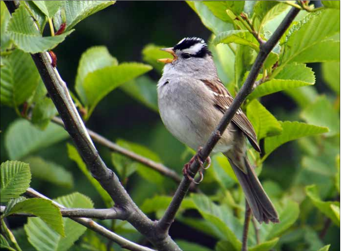
Bruant à couronne blanche, Elwha River Mouth (MD)