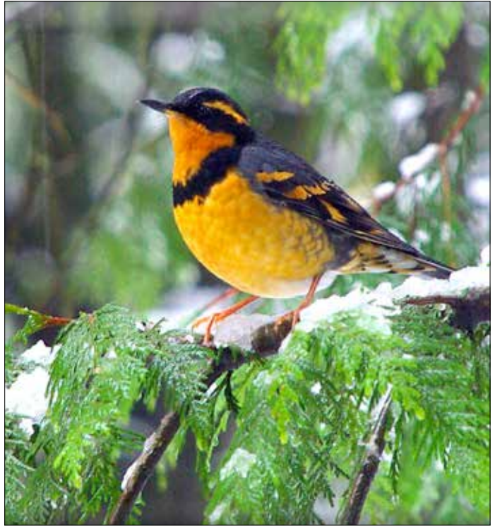
Grive à collier