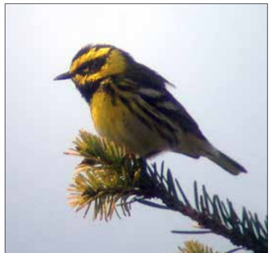
Paruline de Townsend, PN du Mont Olympic (MD)