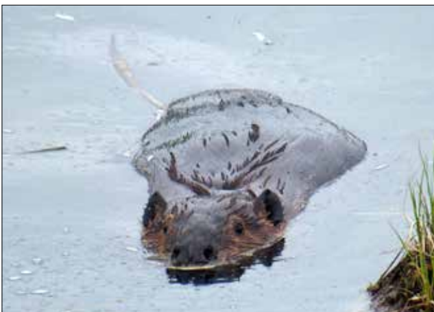
Castor d'Amérique , Elwha River Mouth (MD)