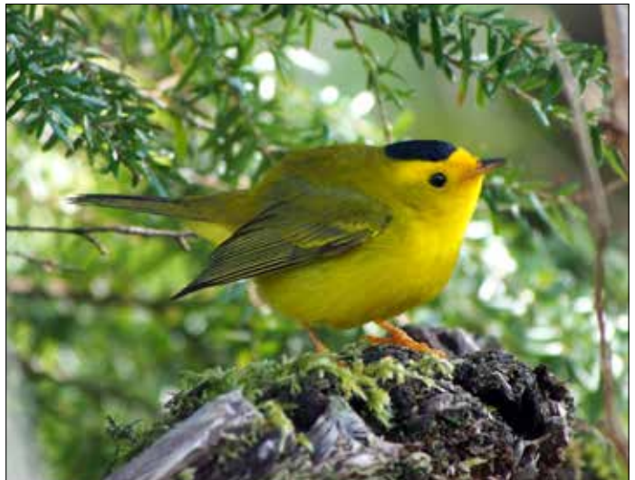
Paruline à calotte noire, Cape Flattery (MD)