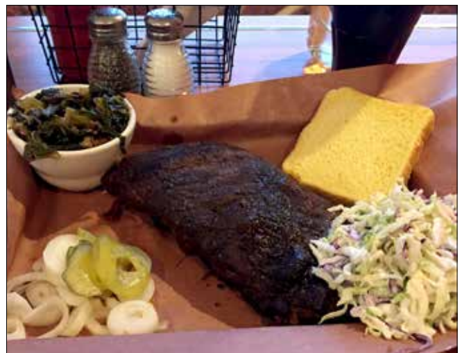
Pork Ribs pour SD au Coyote BBQ Pub, Port Angeles (SD)