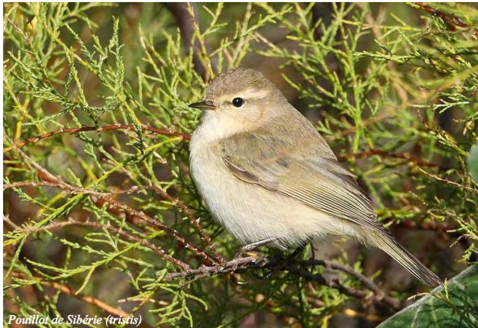
Pouillot de Sibérie (tristis)

dans la dépression de la dune de la Grande Conche (M.-P. & X.H.) le 06/10. Enfin, deux individus présentant les caractères de la sous-espèce sibérienne Phylloscopus collybita tristis ont été observés cette année : 1 individu dans les marais de la Guerche le 16/02 (J.-M.G.) et 1 individu pointe du But le 08/11 (J.-M.G.).