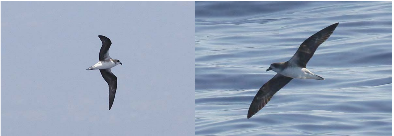
Pétrel des Desertas : à G même oiseau que le précédent, à D, ind. vu le 7.08. Dans les deux cas, le dessous de l'aile est bien noir, avec peu ou pas de blanc aux couvertures sous-alaires.