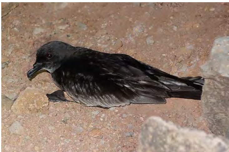
Ci-dessus, oiseau nicheur sur Deserta Grande.