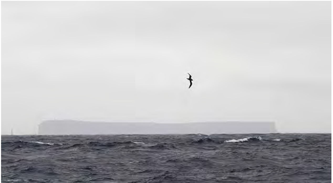
Pétrel des Desertas devant les... Desertas

Crabe Grapsus grapsus – crabe aux pattes rouge et bleu et à la carapace ocre, très beau, vu aux Desertas et dans le port de Funchal