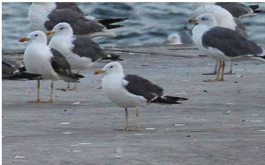
L'oiseau de G est peut-être également un Brun...

I ad. Port de Funchal du 5 au 8, probablement graellsii , peut-être d'autres (pas vraiment détaillé).