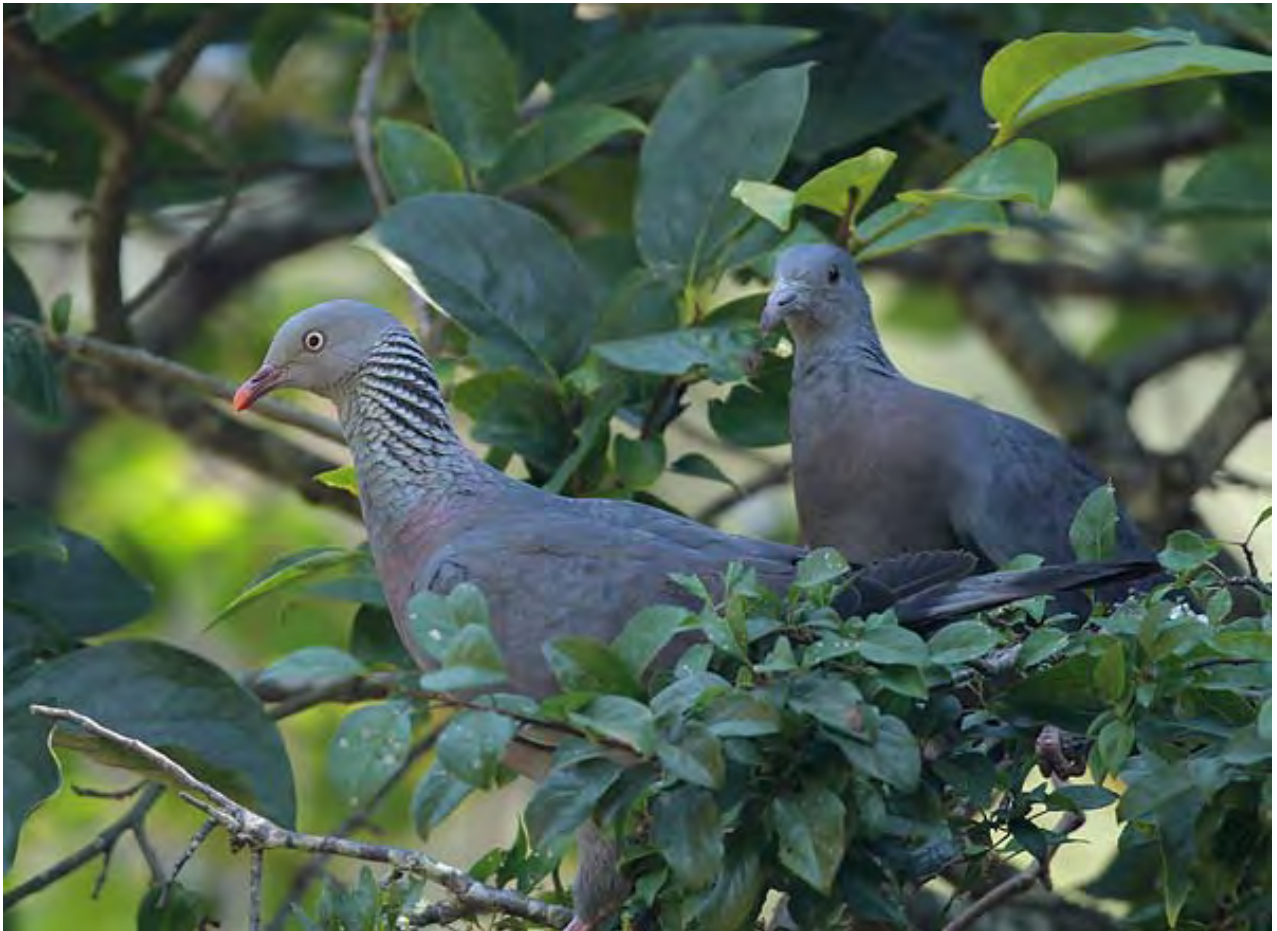
Adulte et jeune

Pigeon biset/domestique Columba livia livia